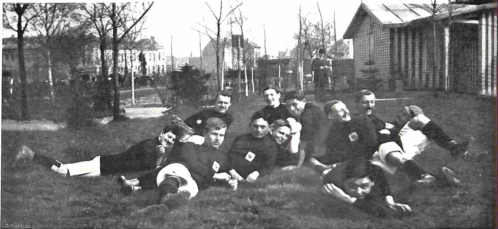
HET NEDERLANDSCHE ELFTAL TE ANTWERPEN.