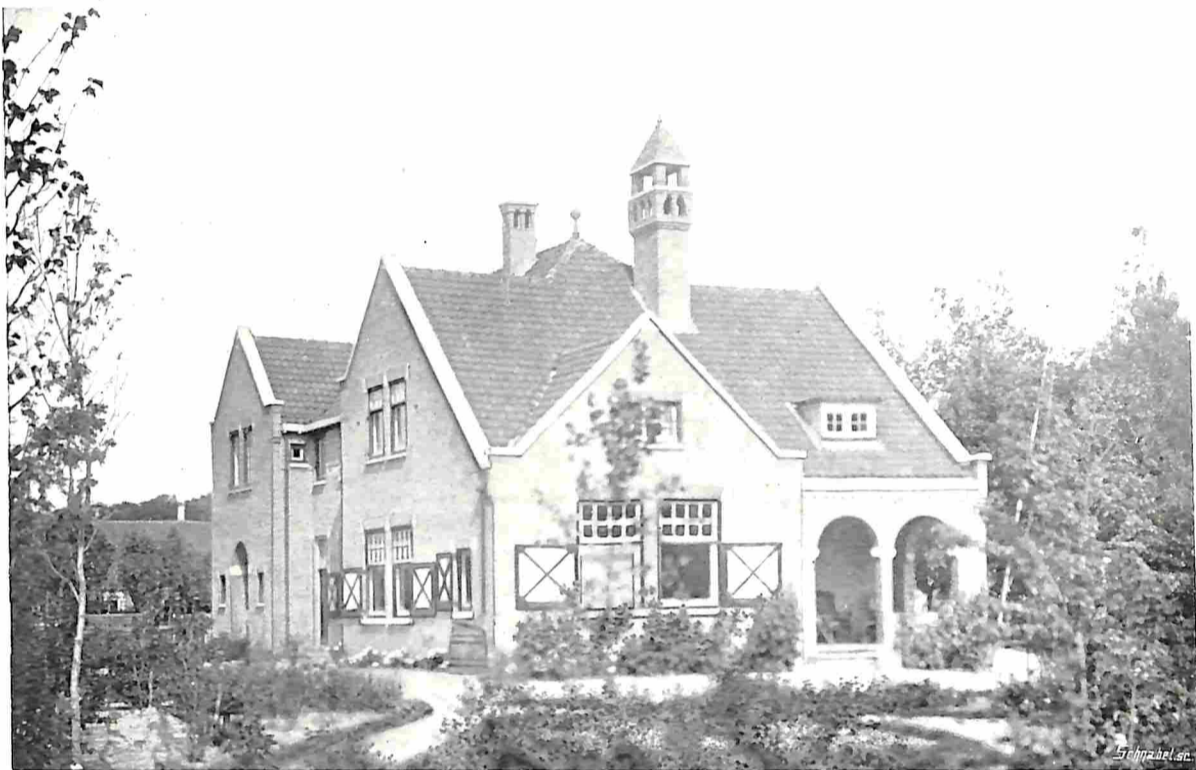
„HUIS TE LANDE” VAN UIT DEN TUIN GEZIEN.

„In de eerste plaats de anatomie, de physiologie en de morphologie der planten, verder de verschillende wijzen van voortplanting,