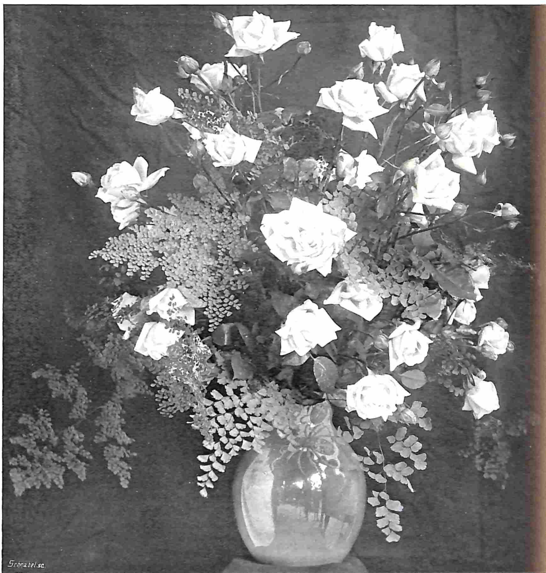
DE MET DEN EERSTEN PRIJS BEKROONDE ROZENVAAS VAN DEN HEER TH. A. VAN ELDIK TE HAARLEM.

„Nu, in zekeren zin zal het een troost voor je zijn te weten, dat ik na je dood met den jongen zal afrekenen. Mijn man ligt daar dood, maar vóór het avond is, zal de jongen ook dood liggen. Waarom wil je wegloopen? Ik ben er zeker van je te zullen vangen. Kleine dwaas, kijk mij aan!"