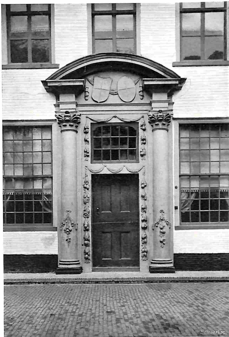
DEUR VAN HET OUDE SLOT OP TEXEL.