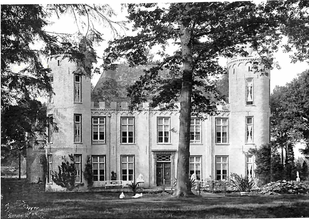
HET SLOT HENKESHAGE AAN DEN ZUIDKANT.

van ieder kasteel de sprekende getuige is. Wij hebben nu een algemeen blik op den staat der buitenordonnantie geworpen, en zijn waarlijk verrast door de afwisseling en de groepeerings der torens en ringmuren, die zoo stijl en star uit de diepe grachten opklimmen.