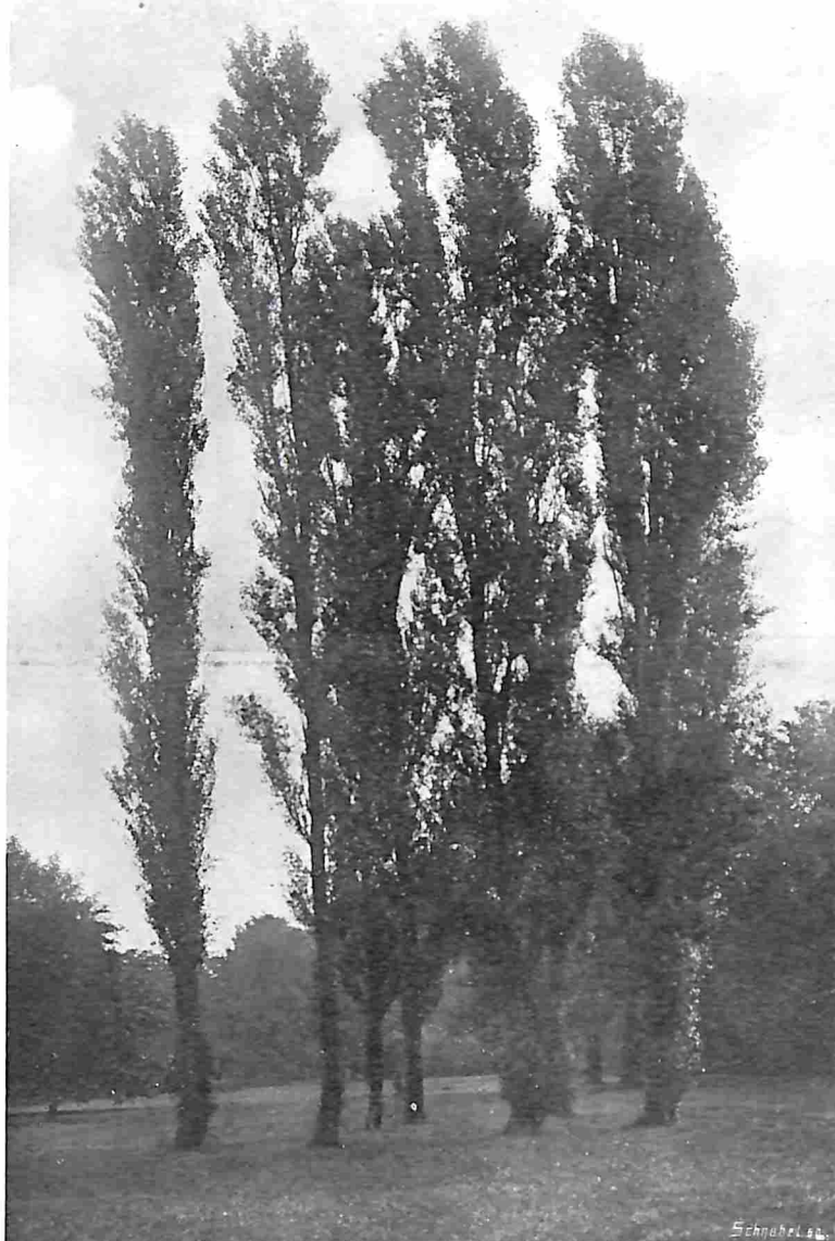
GROEP VAN ACHT ITALIAANSCH POPULIEREN IN HET VONDELPARK TE AMSTERDAM.