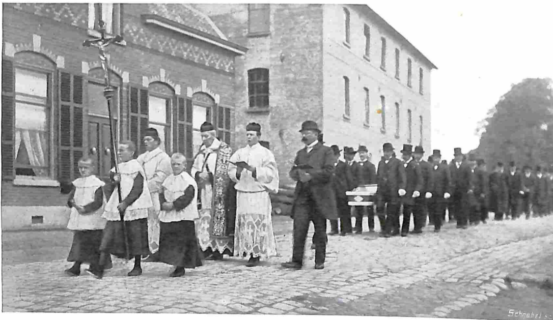
IN EEN WOONWAGEN DOOR NEDERLAND. EEN BEGRAFENIS IN NOORD-LIMBURG.

Het kasteel te Arcen is omringd door dubbele grachten. Over een lange, geweldige steenen brug bereikt men door een zware torenpoort een groot onmuurd voorplein, waar zich de woningen van het dienstpersoneel bevinden. Langs een tweede steenen brug komt men over de binnenslotgracht op het kasteel zelf. Uit een en ander blijkt reeds, dat wij hier met een in de middeleeuwen nagenoeg onneembaren burcht te doen hebben. Vooral bij heldere maan maakt dit trotsche gebouw met zijn geweldige torens, de effen donkere gracht-gapingen en het hooge geboomte er om heen een geweldigen indruk, waartegen zelfs de meest volmaakte cynicus en materialist niet bestand is. Dan