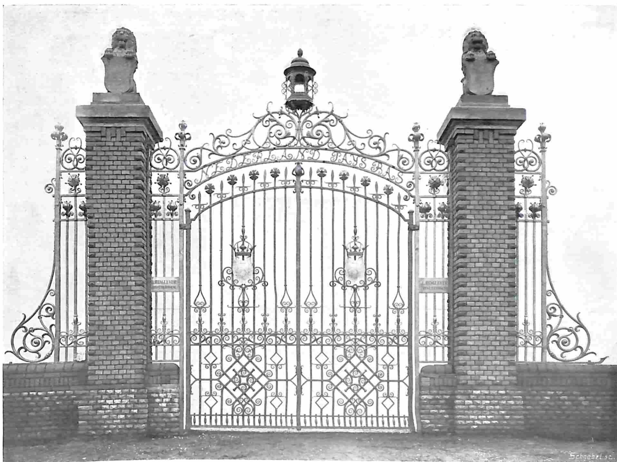
HET HEK TEGENOVER DE DUITSCHE AFDEELING OP DE BRUSSELSCH TENTONSTELLING. Inz. L. Ringlever, Rotterdam.

Aangaande het hek, tegenover de Duitse afdeeling, kan gezegd worden, dat het geheel in het karakter van den Hollandschen Renaissance-stijl is gebleven, ofschoon er geen hekken meer zijn overgebleven van dien aard, die tot toegang voor tuinen dienden en door hun rijke opvatting het heerlijk beeld van dien grooten bloeitijd aangeven. Juist in smeedwerk is de geest van dien tijd zoo