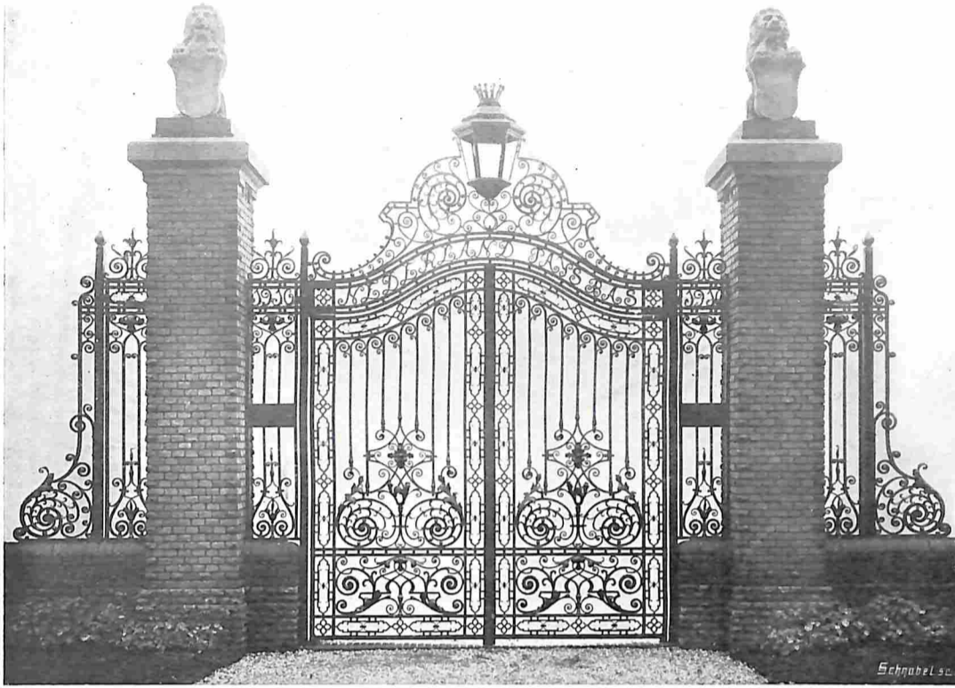
HEK IN LOUIS XIV STIJL TEGENOVER DEN UITGANG VAN HET NED. PAVILJOEN OP DE BRUSSELSCH E TENTOONST. Inz. L. Ringlever, Rotterdam.

Nevens den zwarten Populier is er nog een tweede van oude cultuur, de Kanadeesche namelijk ( Populus canadensis ), die van Noord-Amerikaanschen oorsprong is. Deze is in de tweede helft der achttiende eeuw uit Kanada ingevoerd, en gelijkt zoo zeer op de Europeesche P nigra , dat hij alleen door enkele botanische bijzonderheden daarvan verschilt. Daar hij zich even gemakkelijk en snel laat vermenigvuldigen, werd ook deze spoedig door geheel Europa verspreid, en daar ze volkomen op elkaar gelijken, wordt er in de cultuur niet op gelet wat dan ook geen betekenis heeft. Daar dezelfde soort later ook uit Virginië is ingevoerd, noemde men deze laatste de Virginiësche P. (Populus virginiana) . De eerste uit Kanada overgebrachte was een mannelijke, de Virginiësche een vrouwelijke, die onderling wel eenig verschil opleveren, wat aanleiding gaf ze als verschillende soorten te beschouwen. De Kanada-Populier is ook bekend onder den naam