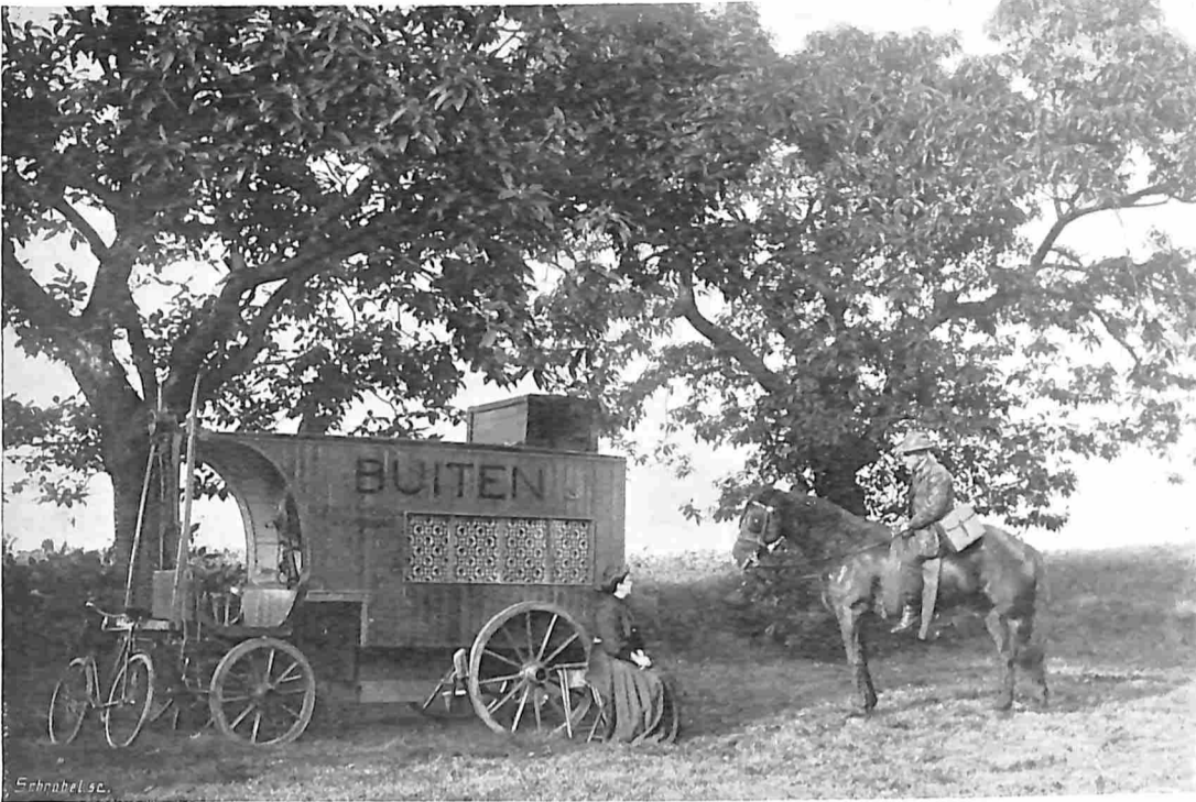
IN EEN WOONWAGEN DOOR NEDERLAND. TERUG VAN EEN OCHTEND-VERKENNING.

gedronken, zaten wij een genoeglijk kaartje te leggen, toen „Hek” buiten opeens vervaarlijk begon te blaffen en er bijna tegelijkertijd geweldig op de deur werd gebonsd. „Willen jullie wel eens als de verd..... opdonderen!” Ik opende de deur met mijn gewone voorkomendheid en voor mij stond met barsch uiterlijk een van de grafelijke jachtopzieners. Ik vertelde den man wie ik was en wat ik kwam doen, doch daarmede verklaarde hij niets te maken te hebben. Dat speet mij zeer, maar mijn paard was bij den molenaar gestald en ik dacht er niet aan van hier te rijden, vóór ik mijne opwachting bij den graaf zou hebben gemaakt. Stond hem dat niet aan, dat was het beste, dat hij zelf maar probeerde mijn wagen weg te trekken. Als laatste poging om hem te vermurwen hield ik hem mijne aanbevelingen onder den neus en bood hem eenige exemplaren van „Buiten” aan. Dit papier scheen een kalmeerende uitwerking te hebben, want zijn toon werd minder barsch en meesmuulende trok hij af.