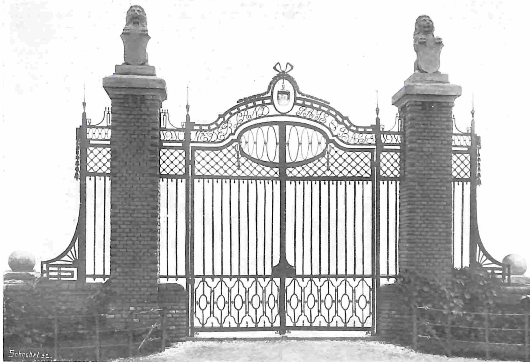
HET HEK VAN DEN NEDERL. TUIN TEGENOVER DEN FRANSCHEN TUIN OP DE BRUSSELSCHE TENTOONSTELLING. Inz. A. J. Dingemans, Amsterdam.

Reeds vroeg in het voorjaar van 1909 werd een aanvang gemaakt met de bewerking van den bodem en in April van dat jaar werden reeds de stam-Acacia's en Buxus geplant. Die bodembewerking heeft