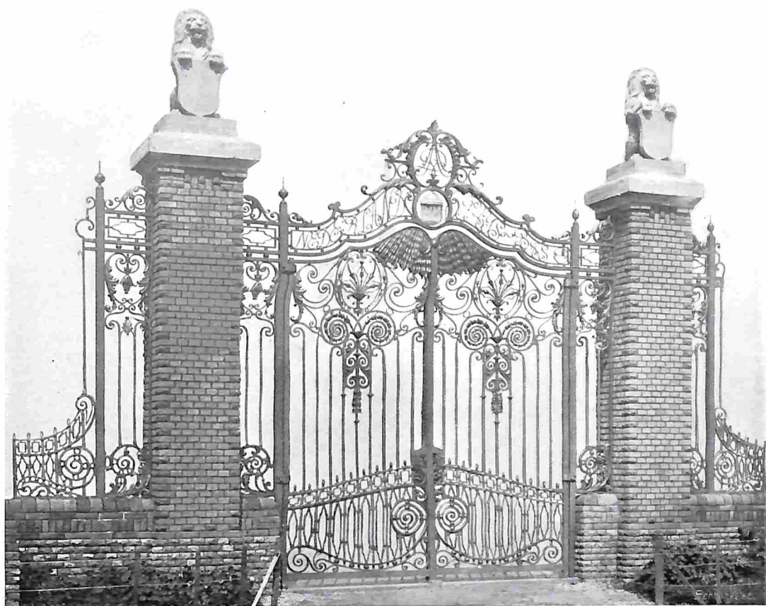
HET HEK VAN DEN NEDERLANDSCHEN TUIN TEGENOVER HET DUITSCHE RESTAURANT OP DE BRUSSELSCH TENTONST. Inz. A. J. Dingemans, Amst.

De groote moeilijkheid hiervan is echter hierin ge- legen, dat men de techniek alleen dan overneemt als zij werkelijk logisch en karak- tervol is; want bij de zoo- genoemde antieke hekken zijn er ook, waarvan de maker angstig elken inlasch ver- meden had, en waarvan dien- tengevolge de vormen, die