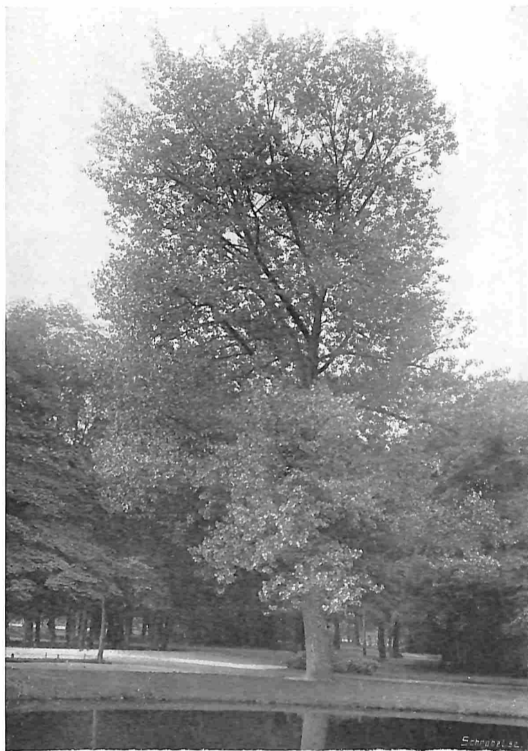
CANADEESCHE POPULIER IN HET VONDELPARK TE AMSTERDAM.

Daar de Esp of Ratelpopulier ( Populus tremula ) eigenlijk de eenige echte inlandsche soort is, zou ook deze voor een eenigszins uitvoerige beschouwing in aanmerking behooren te komen, zoo hij werkelijk als boom van betekenis was. Dat is hij echter hier niet en evenmin in het grootste gedeelte van Midden-Europa; alleen in Hongarije moeten, naar Rossmässler mededeelt, groote boomen ervan voorkomen. Hij ontleent zijn naam aan de bijzondere beweeglijkheid der bladeren, die wel aan alle Popels eigen is, maar niet in die mate. Dit is het gevolg hiervan, dat de vrij lange bladsteel niet rond, maar plat en daarbij aan den voet zeer slap is, zoodat het blad zelfs bij de minste luchtbeweging heen en weer kantelt. Daar de bladeren der dicht bijeenzittende twijgen dientengevolge steeds tegen elkaar aan slaan, veroorzaakt dit een zacht klaterend geruisch. Dat, gelijk Prof. Oudemans zegt, deze heesterachtige boom hier te lande ook wel „Vrouwentongen” wordt genoemd, doelt hier natuurlijk op.