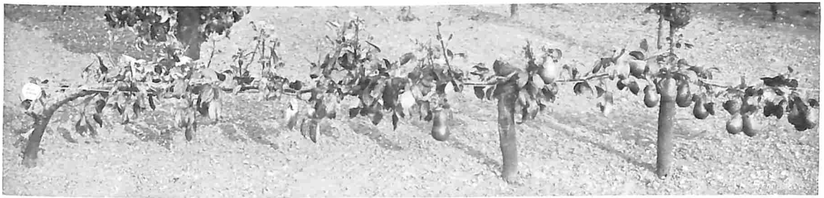
HORIZONTALE SNOER, PEER BEURRÉ LEBRUN.

waar anders niets gepoot kan worden, vinden deze vlakliggende snoeren een gunstig plekje. Ze worden aan een ijzerdraad, dat over eenige paaltjes gespannen wordt, vastgebonden, zooals de afbeelding ook aanduidt. De afgebeelde peer is de Beurré Lebrun, een prachtig geel gekleurde groote vrucht, die zeer goed de tafel siert en voor October bestemd is.