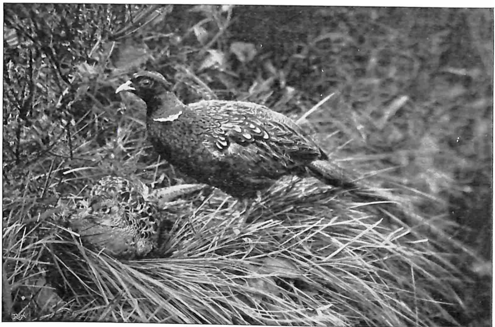
FAZANTEN OP HET NEST.