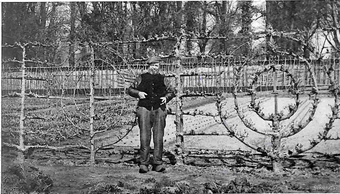
VORMBOOMEN. ENKELE PALMETTEN MET HORIZONTALE EN GEBOGEN TAKKEN.

De eindverlenging van het horizontale snoer is vaak zeer zwak, waarom men ze wel eens ter versterking aan een stok, dien we schuin naar boven laten hellen, tijdelijk aanbindt. Het vlakliggend snoer is vruchtbaar en wordt meestal gevormd met grootvormige variëteiten, omdat deze, kort bij den grond hangend, weinig last hebben van afvallen door sterken wind. Mochten ze vallen, dan kneuzen ze toch nog niet. Langs paden en perken,