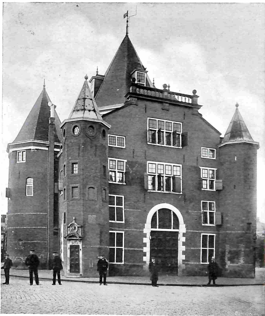
DE WAAG TE AMSTERDAM. NOORDZIJDE.

De volgende poort is wel de eenvoudigste van alle vier — zij