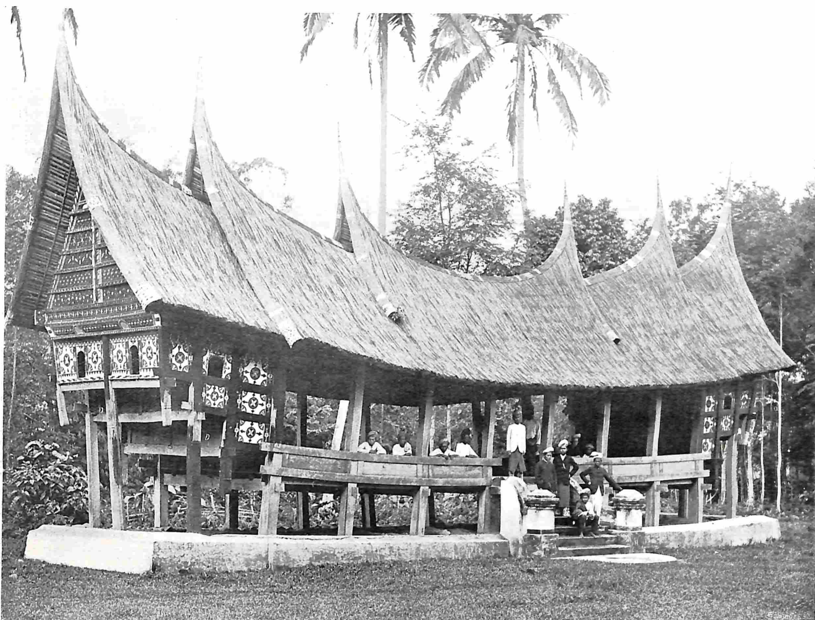
EEN RAPATZAAL IN BATI POEH.