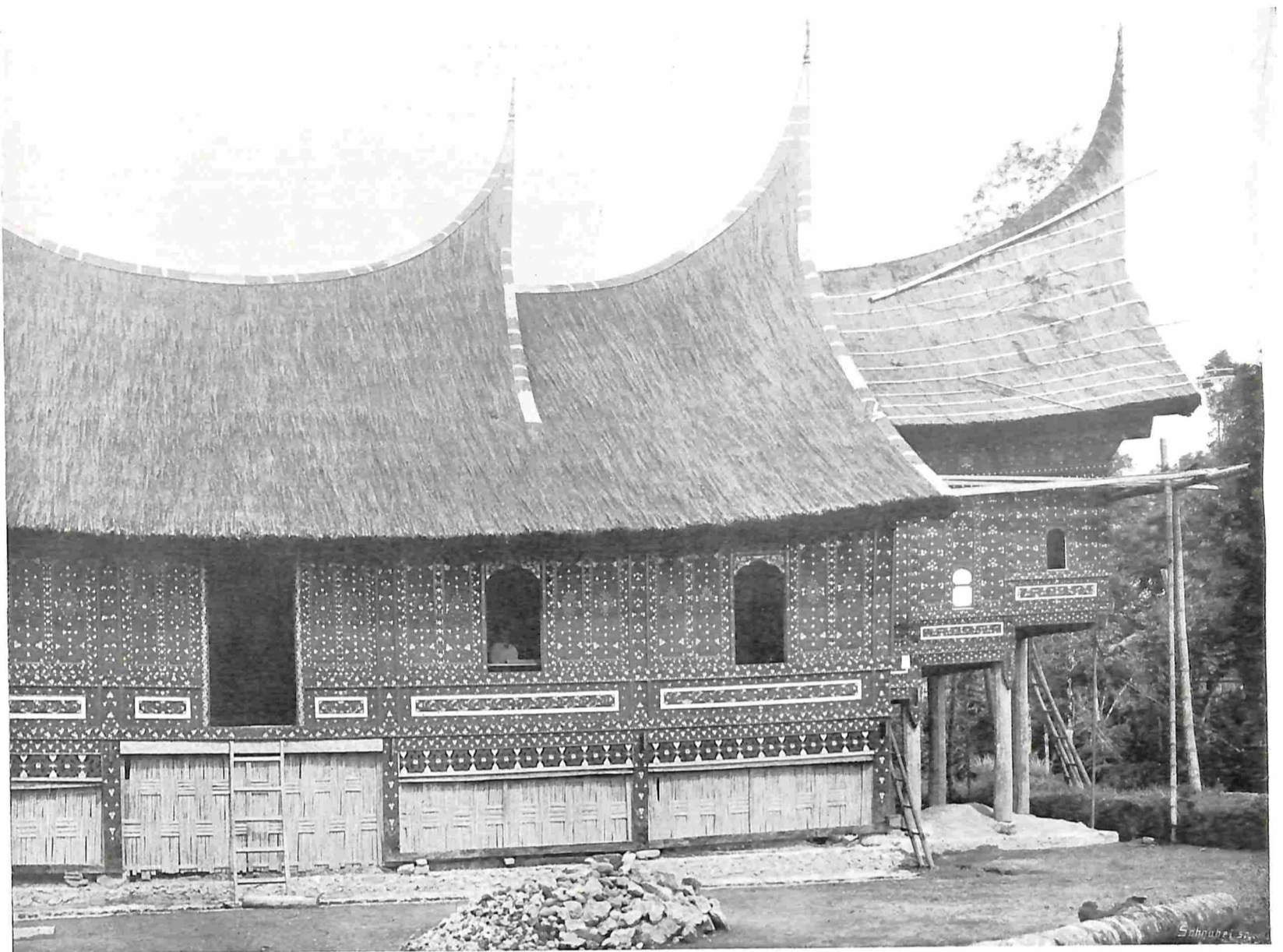
EEN HUIS UIT DE BOVENLANDEN.