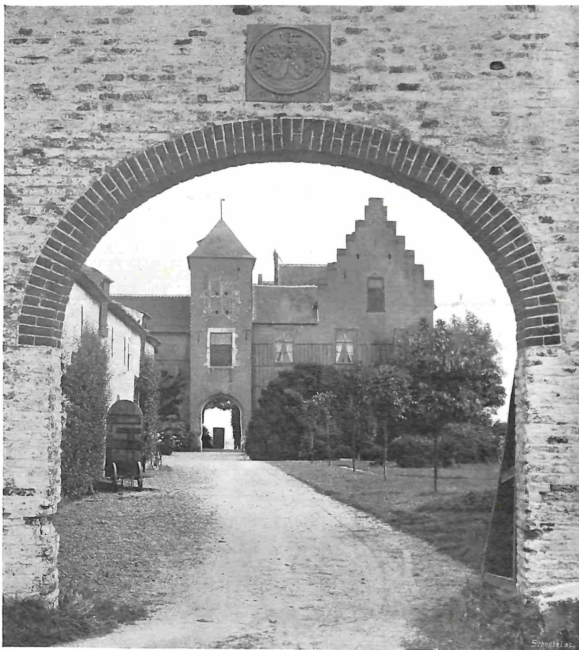
GEZICHT OP HET HUIS HEIJEN IN LIMBURG.