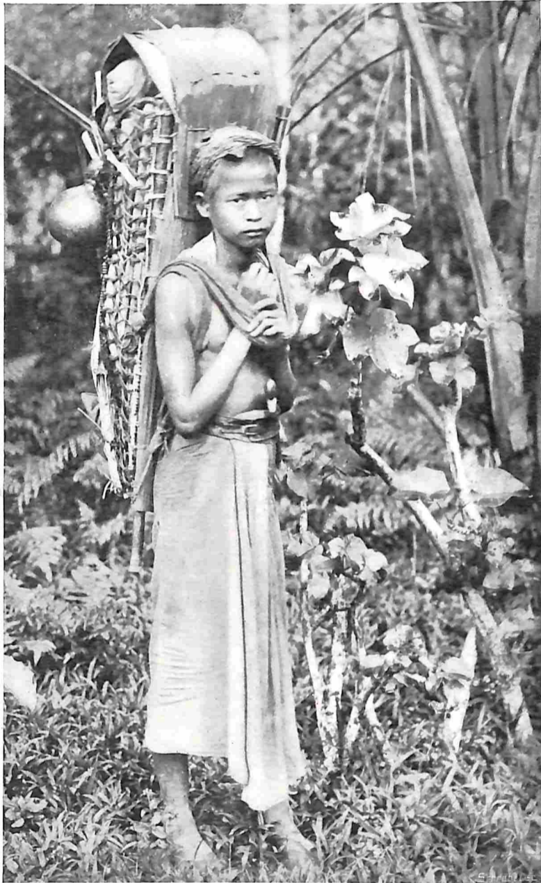
VAN SUMATRA'S WESTKUST. EEN JEUGDIGE KORINTJIER.