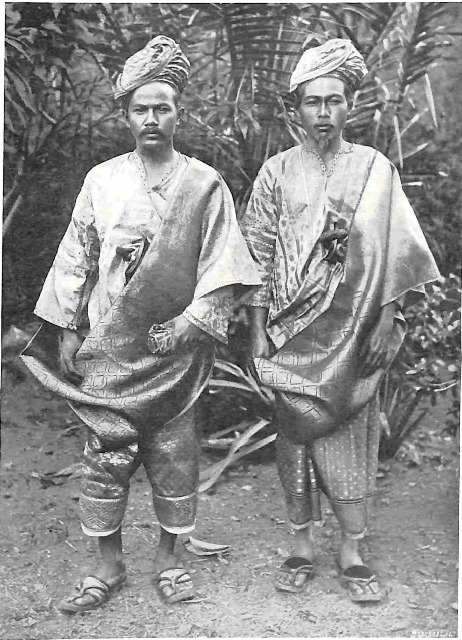
VAN SUMATRA'S WESTKUST. VOORNAME MALEIERS.

Als de Edomieten in den vóór-Christelijken tijd leefden de Heidens van roof en plundering. Over het algemeen was hun aard nog wilder dan die der wolven en zwijnen, in hun dagen op de Veluwe zoo talrijk. Tal van plakaten zijn er uitgevaardigd tegen deze landloopers en vagebonden, die de eenvoudige landbouwers zoo zeer tot last waren en den eenzamen reiziger zoo in zijn tocht bemoeilijkten. Vele middelen werden in het werk gesteld om ze te verdrijven, maar dikwijls te vergeefs. In 1712 trokken op last van den hove van Gelderland 75 ruiters en voetknechten naar het Gortelsche bosch onder Epe, om zich van de laatste daar verblijf houdende heidens meester te maken; 5 jaar later moest tot meer krachtige maatregelen overgegaan worden tegen deze