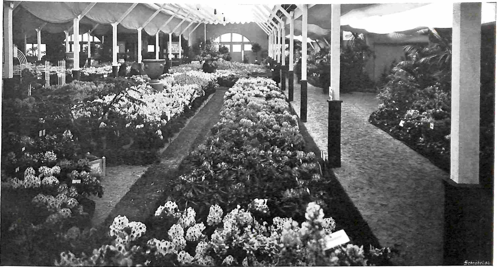
DE BLOEMENTENTONSTELLING TE BOSKOOP. ALGEMEEN OVERZICHT VAN HET HOOFDGEBOUW, VAN HET PODIUM AF.