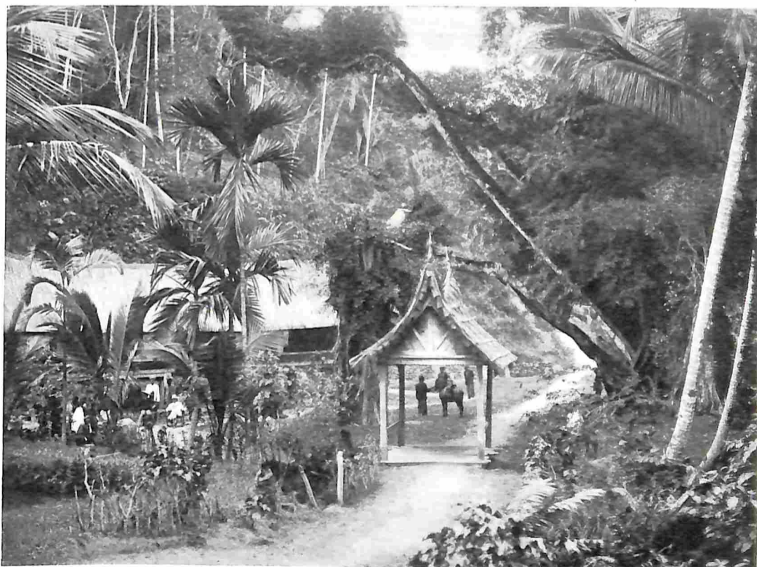
VAN SUMATRA'S WESTKUST. KAMPONG INTERIEUR (SOENGY LASSIE).

De trein brengt ons zuchtende verder opwaarts door groene sawahvelden en langs schilderachtige kampongs tot Padang Pandjang. Hier zijn wij in het hartje van het vulkanenland. Hier zien wij voor ons den eeuwig rookenden Merapi en den eeuwig (?) zijgenden Singgalang, die vooruitspringt achter zijn tweelingbroeder den Tandikat (200 M. langer.) Deze begrenst de kloof van de Aneh-rivier. Ook deze vulkaan is meestal niet werkend, alleen in 1892 en 1906 heeft hij van zich doen hooren, door een plotselinge uitbarsting. Zoo'n beklimning van den vulkaan is wel aardig. Zoo ging schrijver dezes in 1902 d. w. dus eenige jaren voor de tweede uitbarsting, den berg op. Het bovenste gedeelte van den vulkaan is door de uitbarsting in 1892 nagenoeg ontwoond, maar toen ik 10 jaar later boven kwam, zag ik dat zich hier en daar weder bescheiden een boompje vertoonde en struikgewas begon op te schieten; dat is thans weder weggevaagd. (Wordt vervolgd).