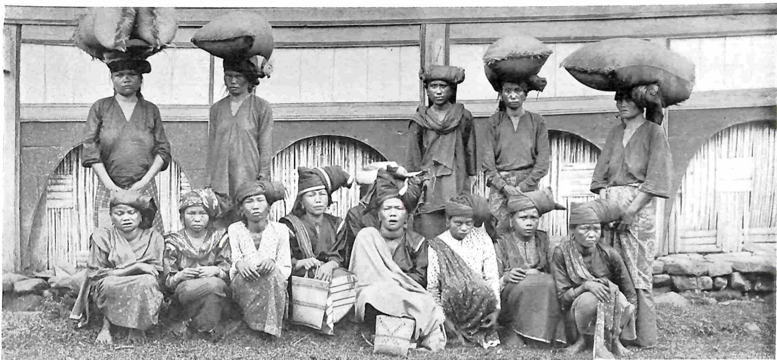
VAN SUMATRA'S WESTKUST.

VROUWEN UIT BATIPOEAH, GEREED MET KOOPWAREN NAAR DE MARKT TE PADANG PANDJANG TE GAAN.