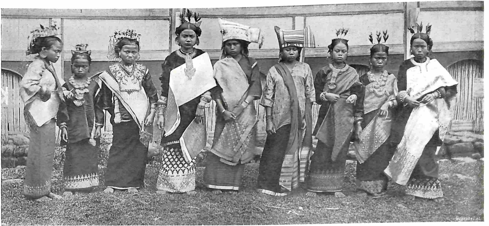
VAN SUMATRA'S WESTKUST. VROUWEN IN FEESTDOS.