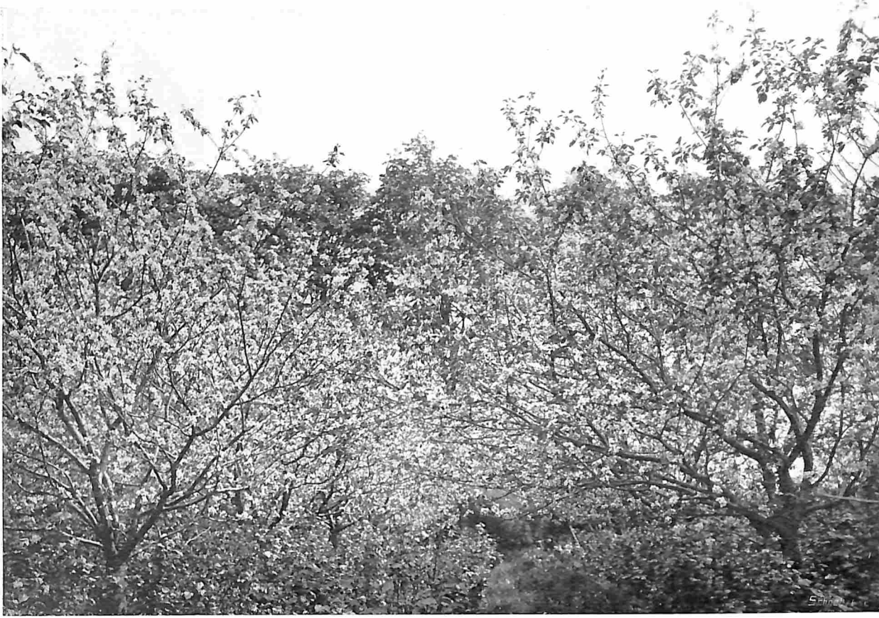
BOOMGAARD IN VOLLEN BLOEI MET BESSEN ALS ONDERTEELT.