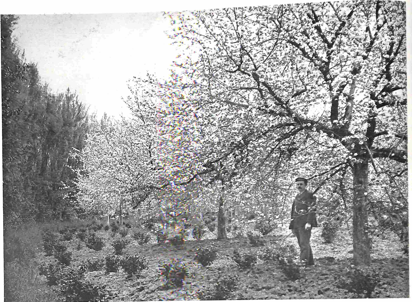
PRACHTIGE JONGE APPELBOOMGAARD MET BESSENSTRUIKEN ALS ONDERBEPLANTING. POPULIER ALS WINDKEERING.