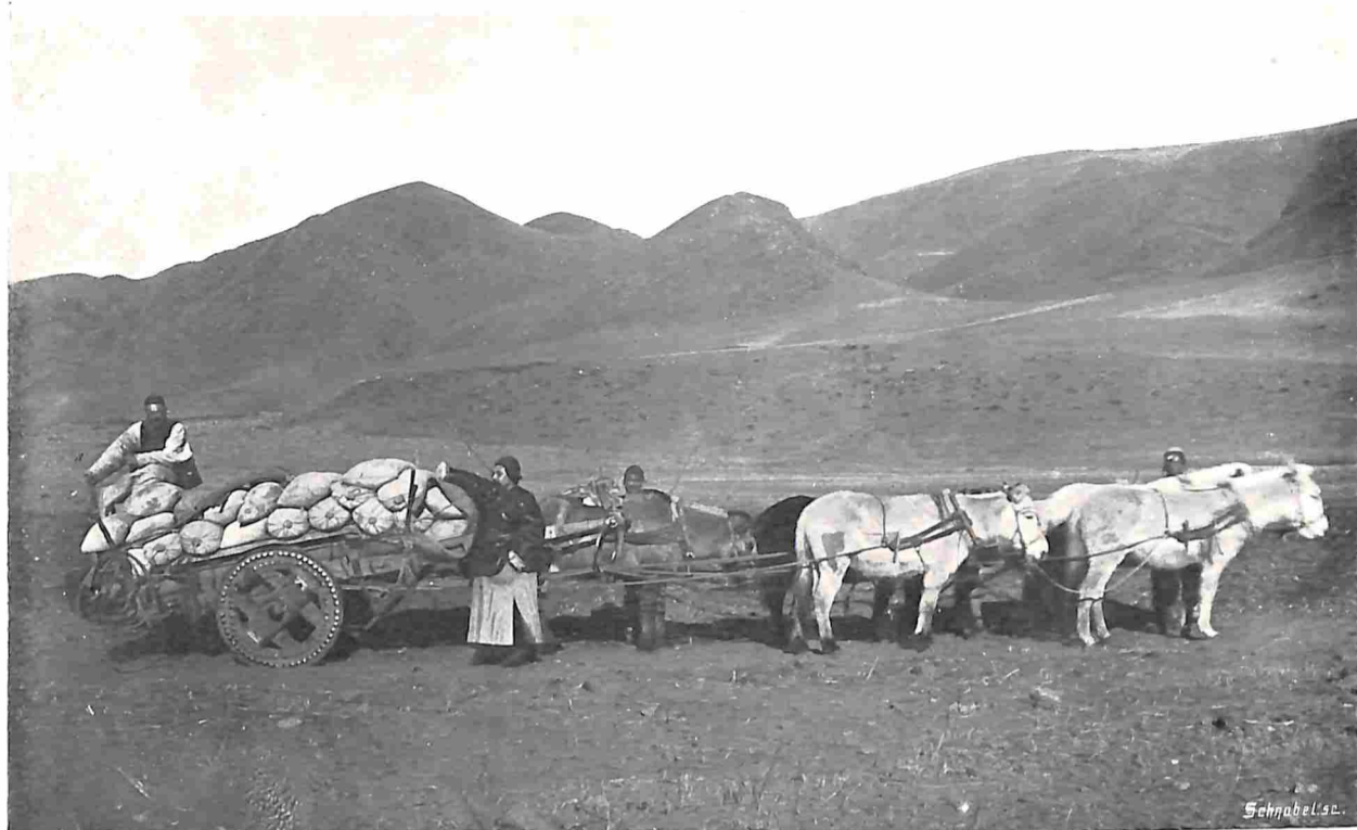
HONGKONG. IN DE BERGEN.

De meest algemeen bekende, ook aan velen, die zich overigens weinig of niet aan planten laten gelegen liggen, is een reeds in 1771 uit China ingevoerde soort, die zich onderscheidt door een groot aantal draadvormige ranken met jonge plantjes, en die daarom bij ons bekend is als de