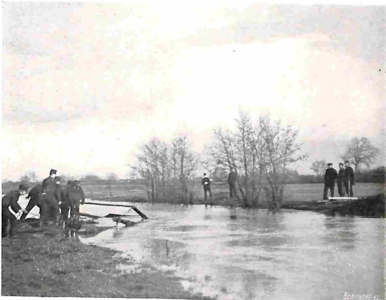
6. DE BRUG TIEN MINUTEN NA DE ORDER VAN AFBREKEN.