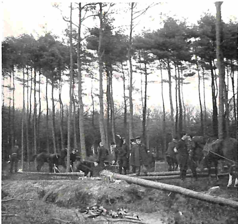
1. HET VELLEN DER BOOMEN IN HET MASTBOSCH.

zoodra de waterdiepte een zekere maat overschrijdt. Kan of mag men die voertuigen in zoo'n geval niet achterlaten, dan blijft er niet veel anders over dan òf hen met behulp van flinke drijflichamen, schuiten, pontons of anderszins over te varen, òf, wat nog veel beter is — tenminste als er tijd en gelegenheid voor is —, eerst zoo gauw mogelijk een brug te maken van voldoende breedte en sterkte om alles, menschen, paarden en voertuigen, in colonne (vandaar de naam „colonnebrug”) overheen te laten trekken.