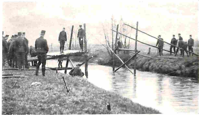
3. HET VASTZETTEN VAN DE OPZETSPARREN.