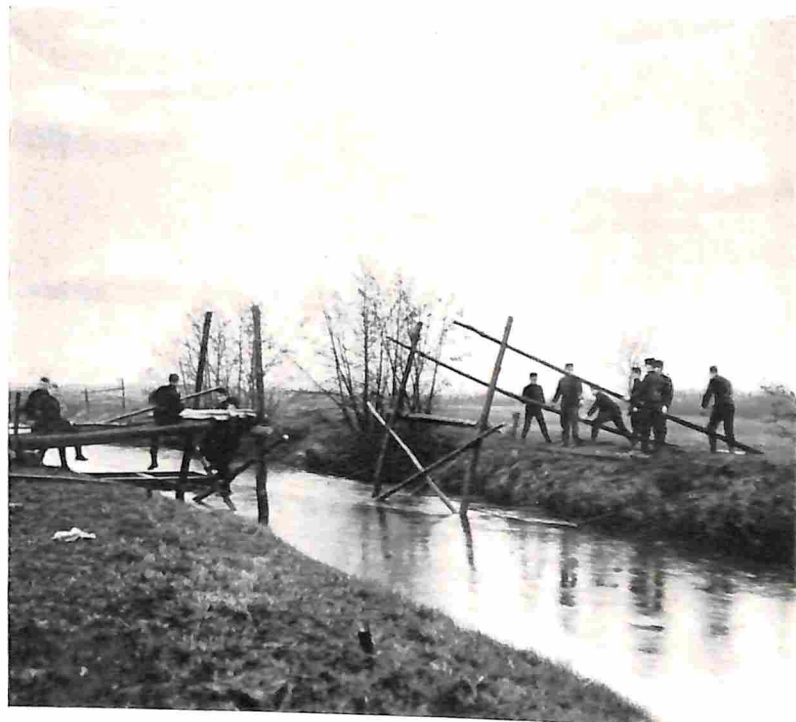
2. HET OPZETTEN VAN DE TWEDE SCHRAAG.

Als plaats voor de brug had men een punt gekozen, waar de rivier zoo normaal mogelijk was, niet al te breed, omdat de brug dan onnoodig lang zou worden, maar toch ook weer niet al te smal, omdat men maar al te zeer reden heeft om te vreezen, dat de rivier op zulke smalle plaatsen ook tegelijk het diepst, de bodem het onregelmatigst en de stroom het hinderlijkst is. Ook