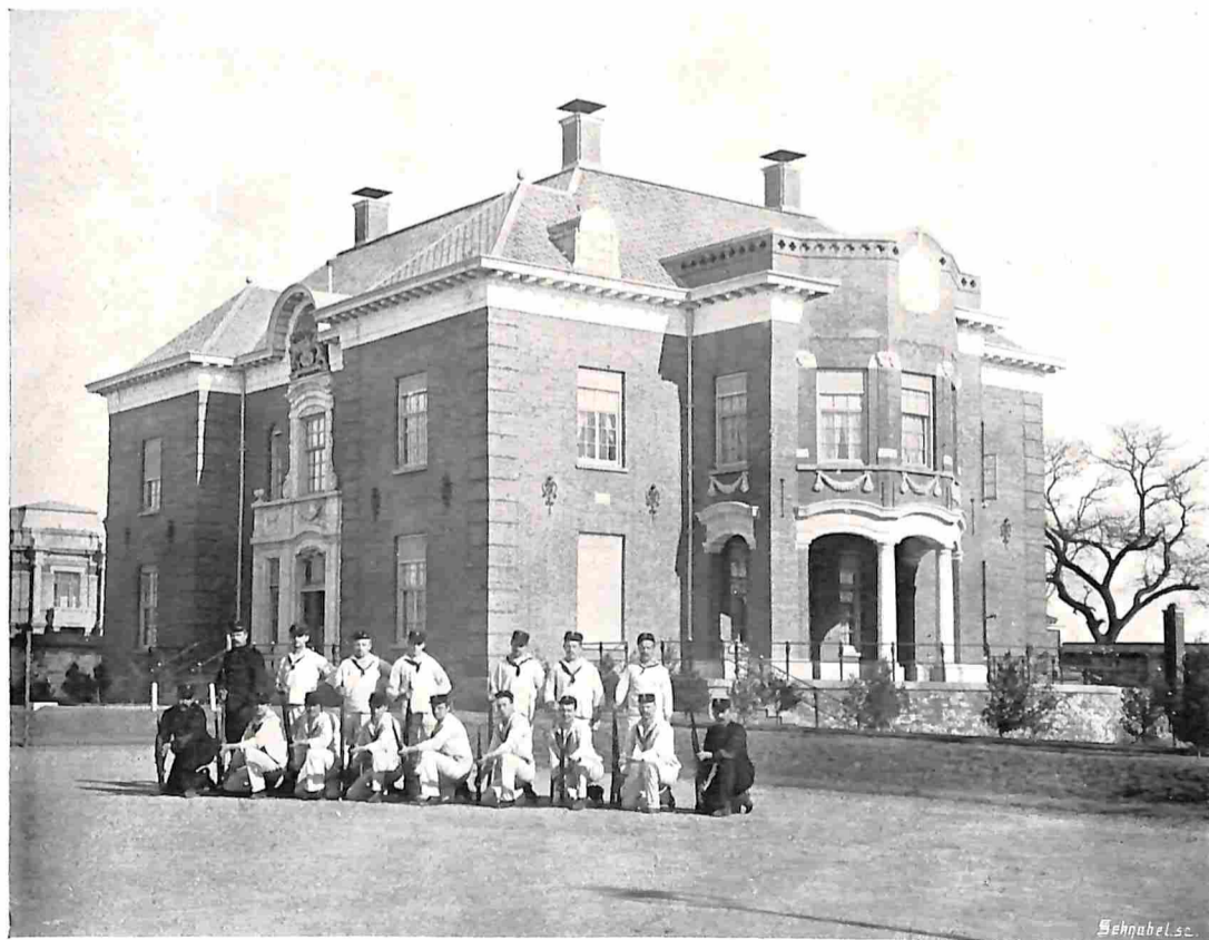
PEKING. GEBOUW MET MARINIERS.