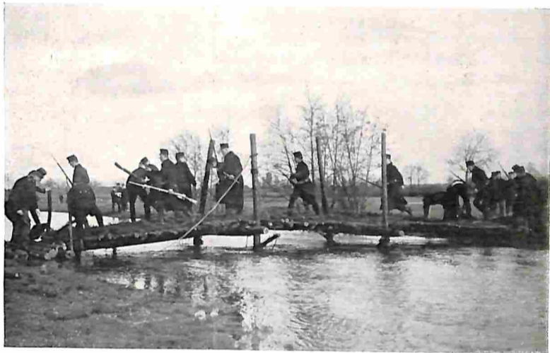
5. EEN AFDEELING TREKT OVER DE BRUG, TERWIJL DEZE REEDS AFGEBROKEN WORDT.