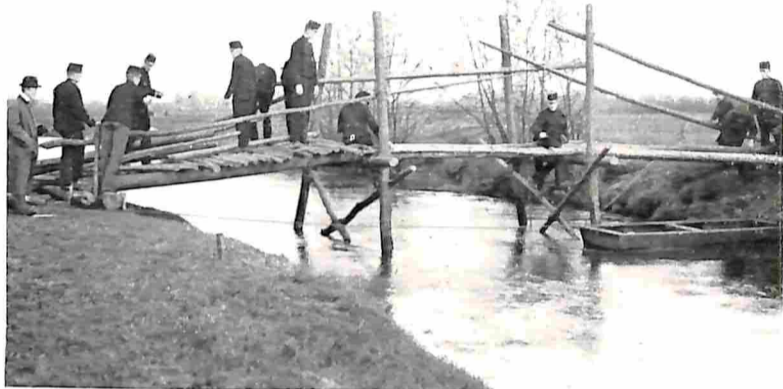
4 HET AANBRENGEN VAN DE LIGGERS.