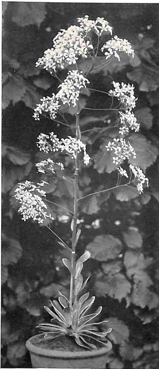
EEN ALPENKIND. SAXIFRAGA.