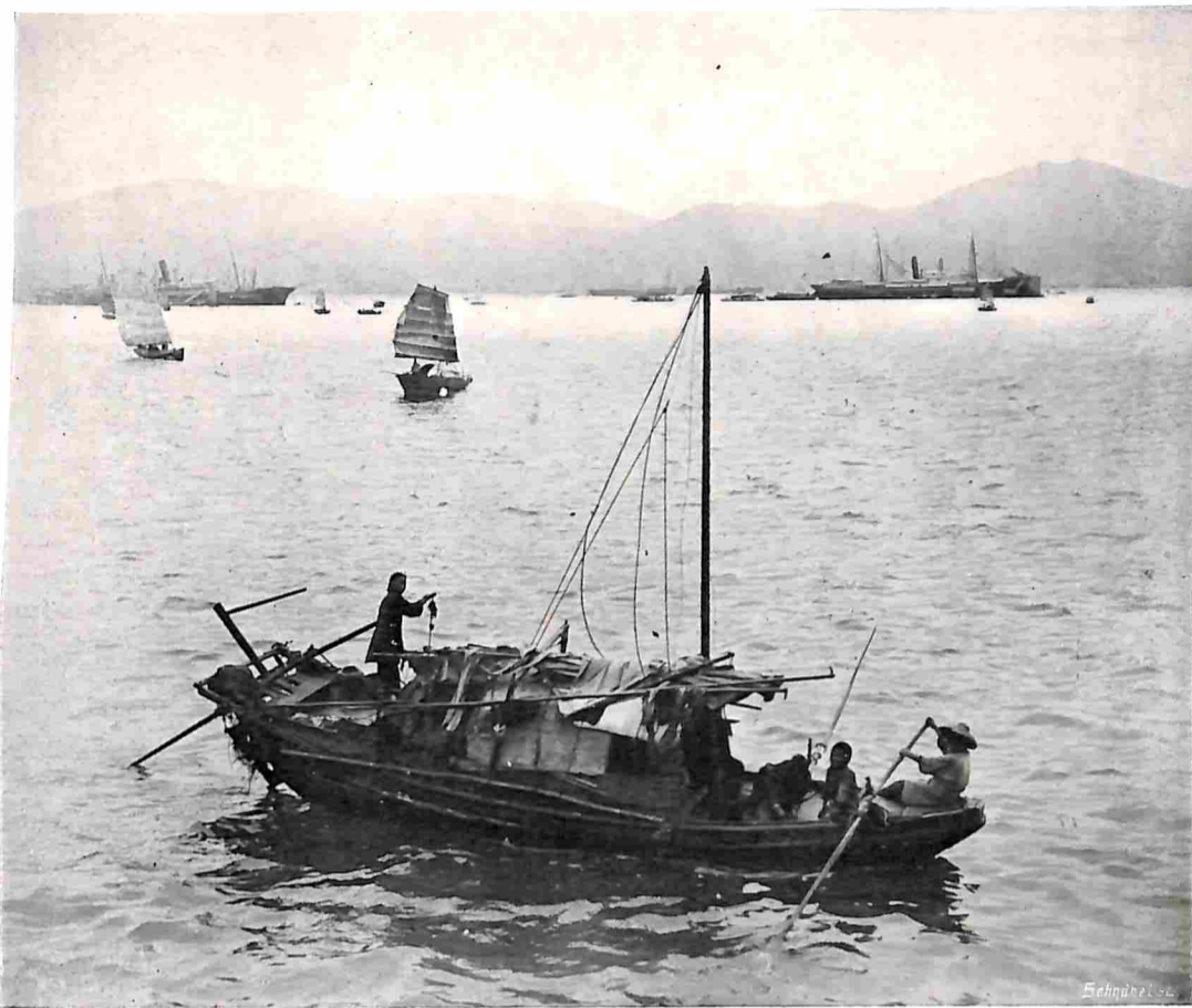
HONGKONG. EEN CHINEESCHE ROEIBOOT.

Maar, al is deze wijze van voortbeweging niet ideaal, toch zijn we maar dankbaar, dat hier nog te hebben, de afstanden tusschen de huizen zijn zoo enorm en het onvermijdelijke klimmen en dalen voor velen te vermoeiend. Het is wel in hooge mate schilderachtig, die mooie groote woningen tusschen en tegen de rotsachtige bergtoppen, die alleen met gras en lage struiken begroeid zijn, zoodat elk huis goed uitkomt. Het wandelen is hier dan ook, vooral 's winters, een groot genot, als men niet tegen het klimmen opziet; bij elke wending van den weg, bij elke