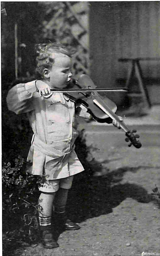
EEN BACH-ARIA IN DE OPEN LUCHT.