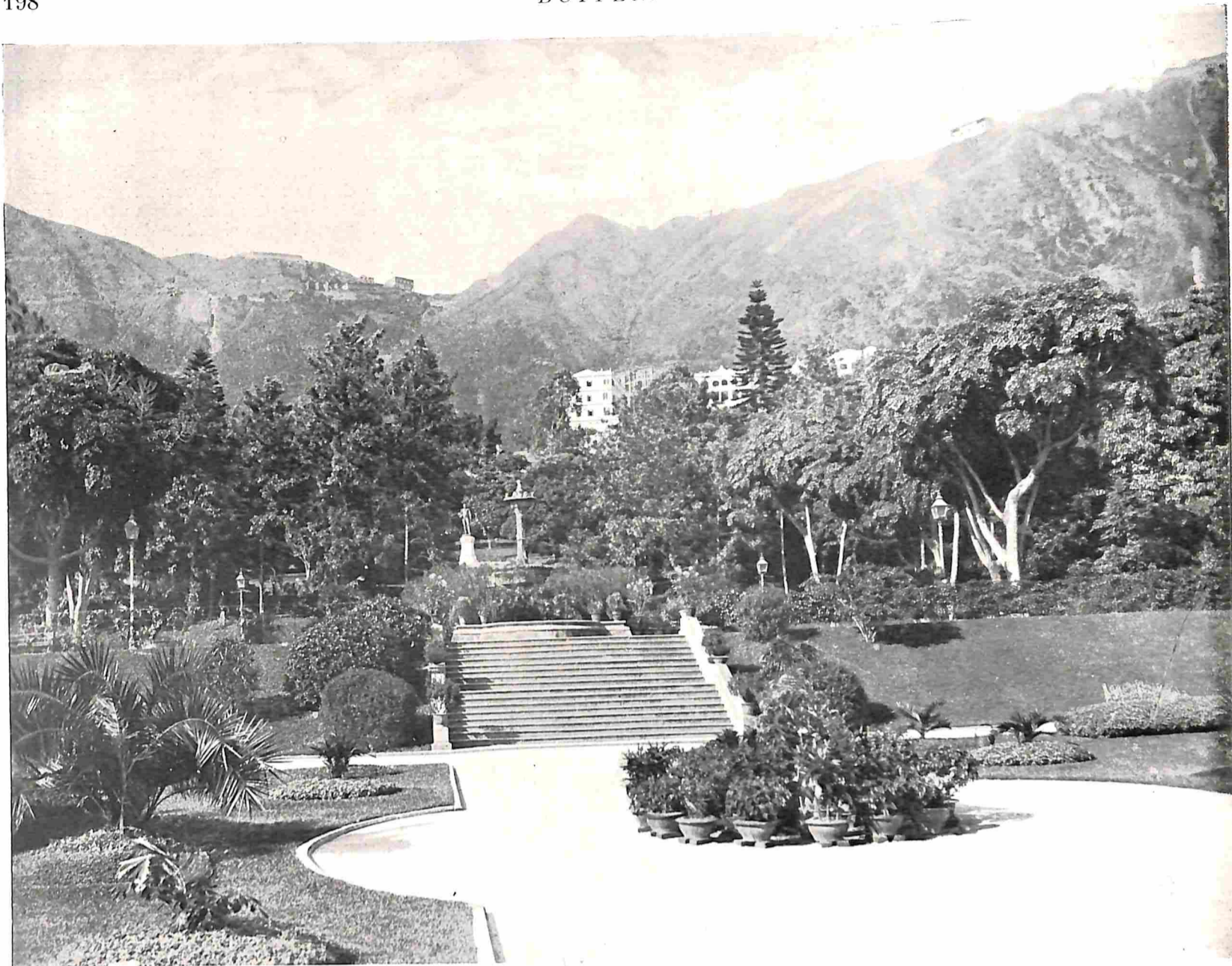
HONGKONG, DE PUBLIC GARDENS.