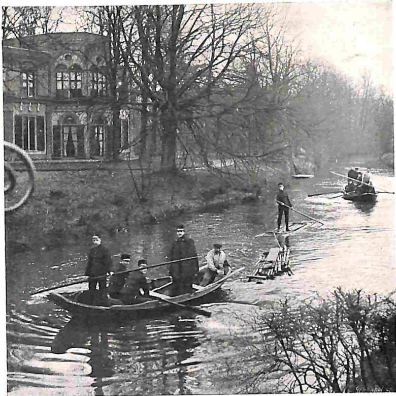
7. DE VLOTTEN NABIJ DE ZOGENAAMDE DUIVELSBRUG TE GINNEKEN.

is het, boven water gelegen, begin het tuitouwen meer of minder duidelijk te zien, benevens het gedeelte van het touw, waarover dit, (zie o.a. bij de 2de schraag op afbeelding No. 3).