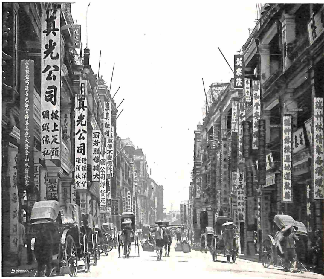
HONGKONG. WINKELSTRAAT IN DE CHINEESCHE WIJK.

bocht een nieuw en bekoorlijk panorama. Maar zooals ik al schreef, de mist hier is iets heel erg onaangenaams. Dagen en weken aaneen dikwijls worden we er door geplaagd. Niet alleen dat er dan van al de schoone omgeving niets te zien is, maar het gevolg er van is ook een groote vochtigheid, die alles doordringt, alles verniet. De muren binnenshuis zelfs voelen klam en nat aan, zijn dikwijls van onder tot boven groen uitgeslagen en beschimmeld. Alles wat je er tegen hangt, alle muurversiering heeft er van te lijden, valt dikwijls na korten tijd verteerd door de vocht uit mekaar. Van behangen geen sprake, de muren worden alleen gecalciumd, maar dat is alleen voor het oog een verbetering. Fijne zijden of kanten toiletjes, zijden voering, mooie gebonden boeken, enz., enz., dat alles heeft hier geen lang bestaan. Het weinige, wat men er tegen doen kan is: al het goed van tijd tot tijd in de droogkamer laten opdrogen. Want