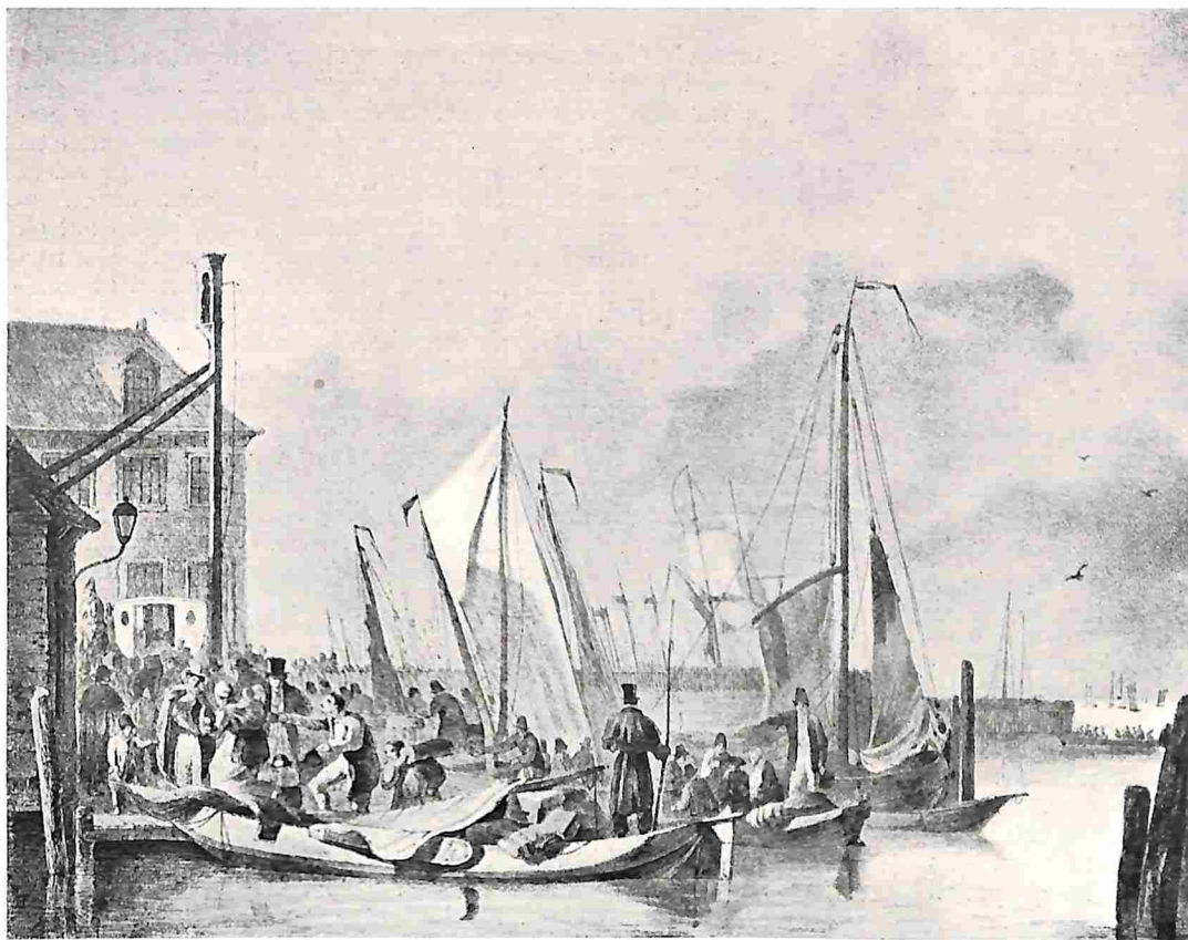
OVERSTROOMINGEN IN VROEGER TIJD. AANKOMST VAN NOORD-HOLLANDSCHE VLUCHTELINGEN TE AMSTERDAM NA DE OVERSTROOMING OP 5 FEBRUARI 1825.

Maar dit zijn kleine bezwaren. Alles samengenomen is het boek van Dr. P. een zeer groote aanwinst voor onze populaire wetenschappelijke literatuur en kan het elken belangstellende in de sterrekunde warm worden aanbevolen. A. A. N.