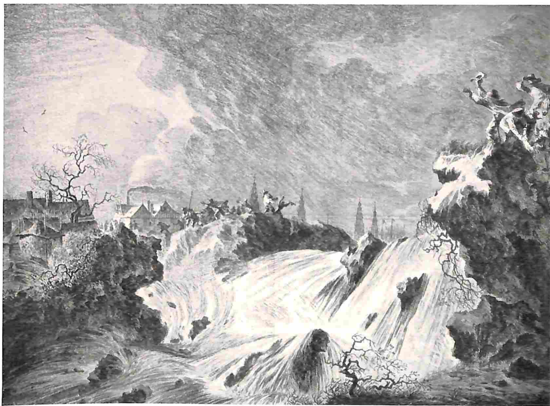
OVERSTROOMINGEN IN VROEGER TIJD. HET DOORBREKEN VAN DEN ST. ANTHONISDIJK BUITEN AMSTERDAM, TEN GEVOLGE VAN EEN HOOGEN VLOED MET STERKEN NOORDWESTENWIND, OP 5 MAART 1651, BIJ WELKE GELEGENHEID HET WATER NOG 3 DUIM HOGER WERD BEVONDEN DAN IN DEN BEKENDEN ALLERHEILIGENVLOED VAN 1570. Naar een gravure door P. Nolpe, naar W. Schellinckx in 's Rijks Prentenkabinet.