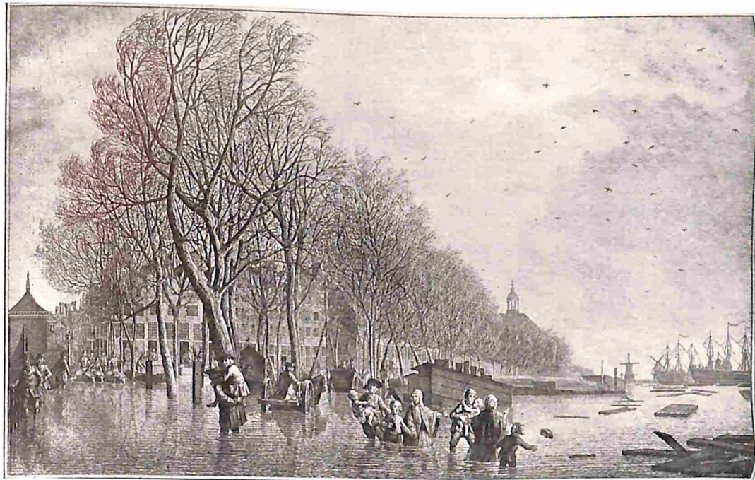
OVERSTROOMINGEN IN VROEGER TIJD. HET OVERSTROOMDE KATTENBURGERPLEIN TE AMSTERDAM, IN DEN MORGEN VAN 15 NOVEMBER 1775. Naar een gravure in 's Rijksprentenkabinet.