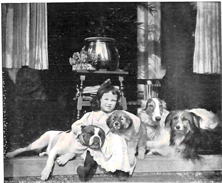
ZUS MET HAAR VIER VRIENDEN.