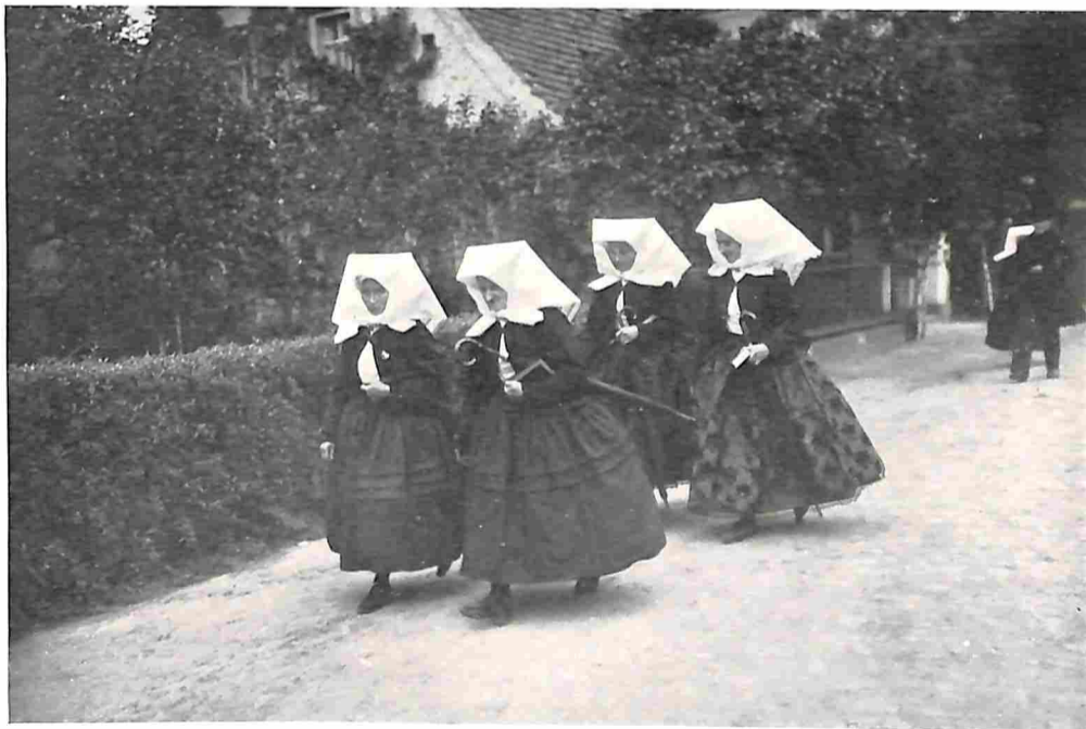
WENDISCHE VROUWEN IN 'T SPREEWALD OP WEG NAAR DE KERK.