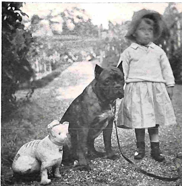
EEN GRAPPIG GROEPJE.

De duiven schrikken op, de kater, zich verraden wetende, ziet met teleurstellenden blik de vluchtende vogels na, en het Winterkoninkje vliegt tergend nader, zet zich op een paar meter afstand van den kater in de warreling van takken