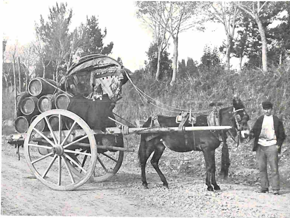
WIJNVERKOOPER IN DE CAMPAGNA BIJ ROME.

zich zooals ze nu cenmaal zijn. En dat is niet veel zaaks! Als buit tenminste niet; want door hun onsmakelijke, taai vleesch, met een laag stevingeplante veeren bedekt, zijn roeken weinig gezocht door de menschen of door roofvogels. In het feit dat ze niets waard zijn ligt inderdaad hun veiligheid. Een onderafdeeling echter der Corvidae, te weten de spreeuwen, zijn bekend om hun keurige vlucht, en deze berust op „zielsvermenging”. Het doet er niet toe hoe groot de troep is — dat is meestal niet te tellen — maar er wordt in volmaakte orde gevlogen. Weer is er niets, dat op de aanwezigheid van een aanvoerder zou wijzen. ( Wordt vervolgd ).