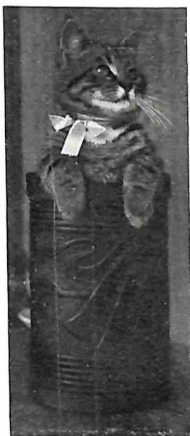
DE LIEVELING DES HUIZES IN DE PRULLEMAND.

aangenaam op één lijn te worden gesteld met zoo'n vormelijk vreaatuur, dat met hem gelijkelijk de gunsten van de „vrouw” deelt, zoo'n dood, harkerig misgedrocht met de