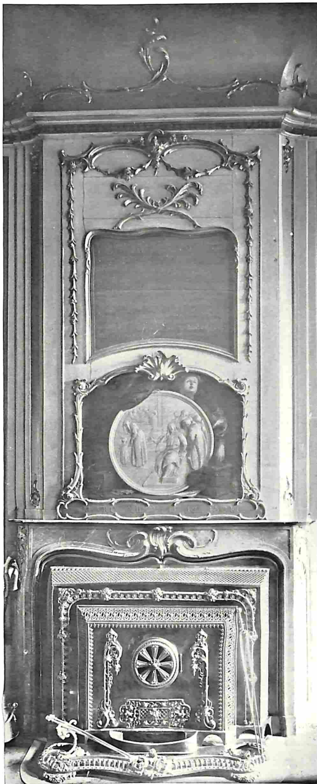
HET R.K. OUDE-ARMENKANTOOR. SCHOORSTEENMANTEL IN DE REGENTENKAMER.

iets anders, had hij overwonnen. Maar nooit daarna kon hij zonder huiveren terugdenken aan die vreeselijke afdaling. Nog drie dagen lang kampeerde hij aan het meer, om weer op krachten te komen en zijn zenuwen te stalen, voor hij zijn reis weder aanving naar de nederzettingen, de onstuimige rivier af. En vele malen per dag wuifde hij een groet omhoog naar dien grooten, witkoppigen, onverschilligen vogel, die daar hoog in het blauw kringen beschreef, of van zijn hoogen wachttorens af op den pijnboom naar de zon zat te staren.