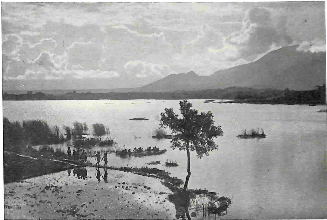
SITOE (MEER) BANGENDIT BIJ GAROET.

het vaartuig der visschers van het meer — een bamboetentje geschoven, en daarin een leunstoel gezet. Hij behoefte slechts op te stappen, vier knapen zullen hem doen spelevarens op het doorschijnende watervlak . . . . De vulkanen om den lichtblauwen waterspiegel zijn met witte wolflarden omneveld; geen geluid dan het watergeplasp tegen de langzaam voortglijdende cano's, dan, aan de overzijde, het weemoedig geklik-klak van een andere „angklong", onzichtbaar, samenvloeiende met het maatgeklank van de neerghurkte groep aan den oever. Dit alles bezit een zoetheid van haast bedwelmenden weedom . . . Aldus Wagenvoort, en hij overdrijft niet! \text{\textcircled{N}} Even benoorden den oorsprong van de Tji-Manoek naderen de hellingen van den Tjikorai dicht tot die van den Papandajam, en heeft de rivier een diep, steilwandig dal tusschen beide uitgegraven. Met den Goentoer en den aan den Oostelijken oever gelegen bergreus, den Galoenggoeng, vormen Papandajan en Tjikorai een kring van wachters, waardig om de bekoorlijke bergfee, Garoet, in bescherming te nemen.