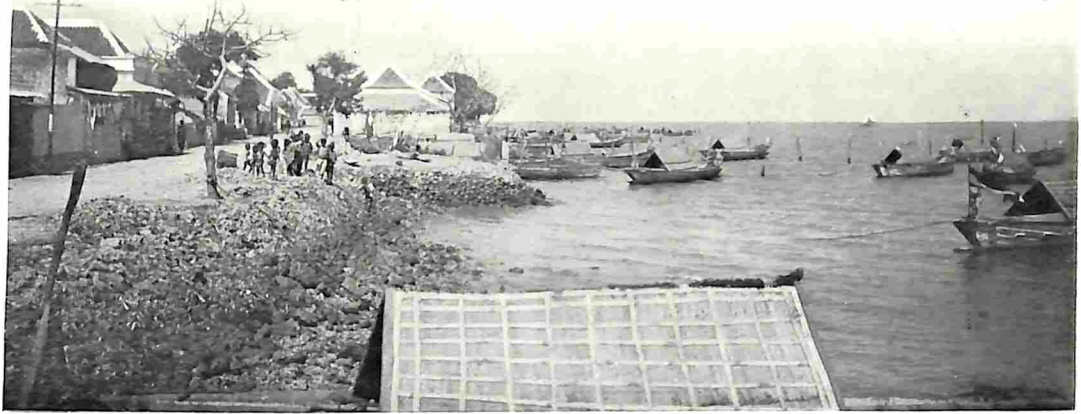
KAMAL OP HET EILAND MADOERA.

doera-stoomtram, waarvan de hoofdlijn langs de Zuidkust van het eiland via Sampang, Pamekasan en Soemenep naar Kalianget loopt, het Oostelijk eindpunt der stoomtram. Kamal is vlak tegenover Soerabaja aan het smalste gedeelte van Straat Madoera gelegen en de groote postweg over het eiland, welke de vier hoofdplaatsen Bangkalan, Sampang, Pamekasan en Soemenep onderling verbindt, vindt eveneens te Kamal zijn beginpunt. De geregelde verbinding tusschen Soerabaja en Kamal wordt o.a. door eenige malen daags heen en weer varende stoombootjes der Madoera-Stoomtram-maatschappij onderhouden. Kamal is de belangrijkste uitvoerplaats van vee en huiden van de geheele residentie Madoera, die bekend is door zijn uitmunten den veestapel. Op korten afstand ligt vlak aan zee een groot quarantaine-station voor Soerabaja.