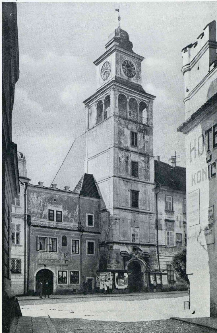
BOHEEMSCHE BURCHTEN. TREBON (WITTINGAU)