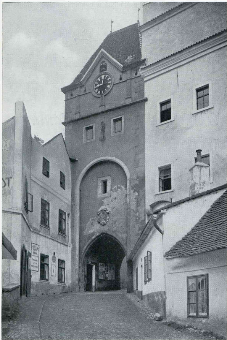
BOHEEMSCHE BURCHTEN. JINDRICHUV HRADEC (NEUHAUS)