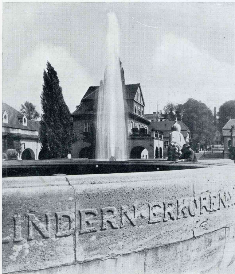
BAD NAUHEIM. SPRUDELHOF

N U de kwestie van de te groote boomen door rooien zal worden opgelost en door het plaatsn van perensnoertjes aan den zuidkant en platte morellen aan de noorderschutting aan den wensch naar vruchtboompjes in onzen stadstuin ook voldaan is, hebben wij onze aandacht gewijd aan de verdere indeeling. ☞ Wij willen een ruim pad in het midden van onzen 6 Meter breed tuun, waarop wij ons goed kunnen bewegen, verder een smaller paadje aan het eind naar de brandgang; het hoofdpad kan dus gevoegelijk 2 M. breed worden, dan houden wij ter weerszijde een rabat of border van dezelfde breedte over. ☞ Nu is de vraag: waarmede zullen wij dit ruime wandelpad aanleggen? Grint of schelpen is ouderwetsch, onpractisch ook door de kans van moeilijk uit te roeien onkruid erin en het geraken van steentjes tusschen de planten in de borders. Dan lokt ons meer aan een beloopbaar graspad, zooals wij onlangs zagen, met op stapwijdte flagstones er doorheen gelegd ter afwisseling en in het midden een zonnwijzer! Of zouden wij, hoewel nog al duur in aanschaf, wel uitsluitend flagstones willen leggen, omdat dit zoo'n fraai en zindelijk pad geeft. Maar wij hebben van