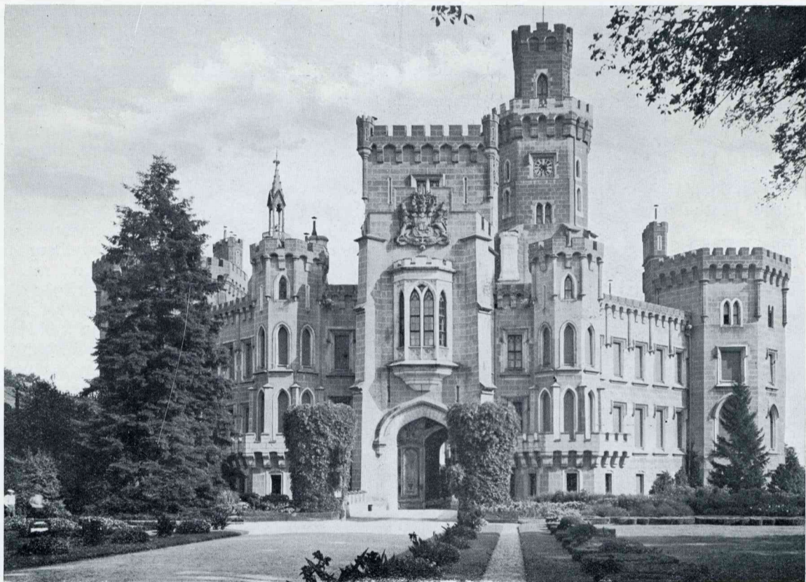
BOHEEMSCH BURG. HUBOKÁ (FRAUENBERG)

waarvan sommige de stad zeer dicht naderen. Het lijkt wel, dat zij uit naijver de schoonheid daar beneden vernietigen en onder zich begraven willen. ☞ Ook de Moldau, die zich hier met koortsachtige haast door nauwe bochten wringt, schijnt uit haar humeur. Maar de naijver der bergen en het toornen der Moldau harmonieeren wonderlijk wel met het karakter van Krumau. Slechts weinig steden wisten hun Middeleeuwsch voorkomen zoo goed te bewaren, als deze stad. Iedere straat is een schilderij; ieder hoek schenkt een verrassing. Over den oorsprong van de stad weet de geschiedenis weinig. Zij ontstond rondom een kasteel, waarvan vermoedelijk zekere Witigo de grondlegger was. Diens afstammelingen kregen niet alleen groote macht in Bohemen, maar ook hebben zij dikwijls op den Poolschen Landdag, in het Duitsche Rijk, aan het Weener Hof en in Hongarije door politiek inzicht invloed gehad op den loop der gebeurtenissen. Wij zien het nu eens aan de zijde van het Boheemsche koningshuis, dan weer in een ander kamp, als zulks voordeelig schijnt. Zoo vinden we tijdens den oorlog, die Koning Ottokar II tegen Keizer Rudolf van Habsburg voert, Zawisch van Falkenstein uit het geslacht der Witigonen aan het hoofd van de in oproer gekomen Boheemsche edelen. De