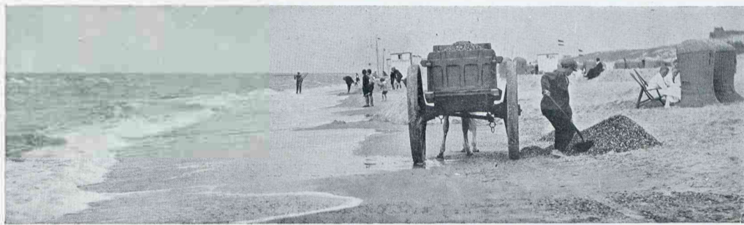
AAN HET STRAND TE EGMOND AAN ZEE

aarde tegen bevrozing te behoeden, zoodat, naar alle waarschijnlijkheid, vóór dien tijd alle leven van de aarde verdwenen zal zijn. ☼ Laten we echter, in plaats van ons te verdiepen in bespiegelingen aangaande deze tamelijk droevige toekomst, achterwaarts zien en trachten het verleden van onze zon in oogenschouw te nemen. ☼ Aanvankelijk zien wij haar slechts als een donziger, groter en tevens helderder bol dan nu. We kunnen ook verder achterwaarts zien naar den tijd toen ze nog in 't geheel geen ster was, maar een nóg donziger gasmassa, die zich met duizenden andere in een nebula van vlokkig gas bevond — de nevelvlek, die bestemd was ten slotte te verdichten tot onze eigen sterrenstad. En de rest der wereldruimte is eveneens ingenomen door andere gasachtige nevelvlekken, die na verloop van tijd andere sterrensteden zullen vormen. ☼ Zelfs nog verder kunnen we achterwaarts zien, ofschoon we ons dan tamelijk door gissingen laten leiden. Stel u voor, dat in den aanvang van den tijd de geheele substantie door de wereldruimte verspreid was in den vorm van gas, welk gas even gelijkmatig door de ruimte verspreid was als de lucht, welke wij inademen verspreid is in een groote hal of kathedraal. Het is te bewijzen, dat het gas dan niet gelijkmatig door de wereldruimte verspreid zou blijven. Precies zooals een wolk tot druppels water condenseert en zooals een nevelvlek van gas tot sterren verdicht,