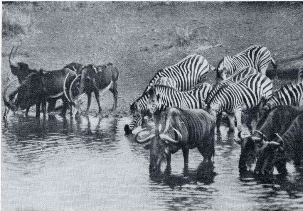
SABELANTILOPEN, ZEBRA'S EN BLAUWE WILDEBEESTEN ALLE BE- WONERS VAN ZUID-AFRIKA'S VLAKTEN, LESSCHEN HUN DORST

te garandeeren. Nadat eerst alle koffers waren op- geladen, begon het vehikel eenige ste- vigheid te verkrij- gen en toen ook de passagiers naar binnen geheschen waren, tot zelfs de- gene in ons gezels- schap, die eerst be- weerd had nooit of te nimmer in die kast te willen gaan zitten, kwam er evenwicht en ons wagentje ging er nu van door. ☼ We reden eerst door het mooie bosch op den Börser- berg, een dennen- woud vol donkere diepten, daarna ging het hooger op, voerde de weg langs rotsige steil-