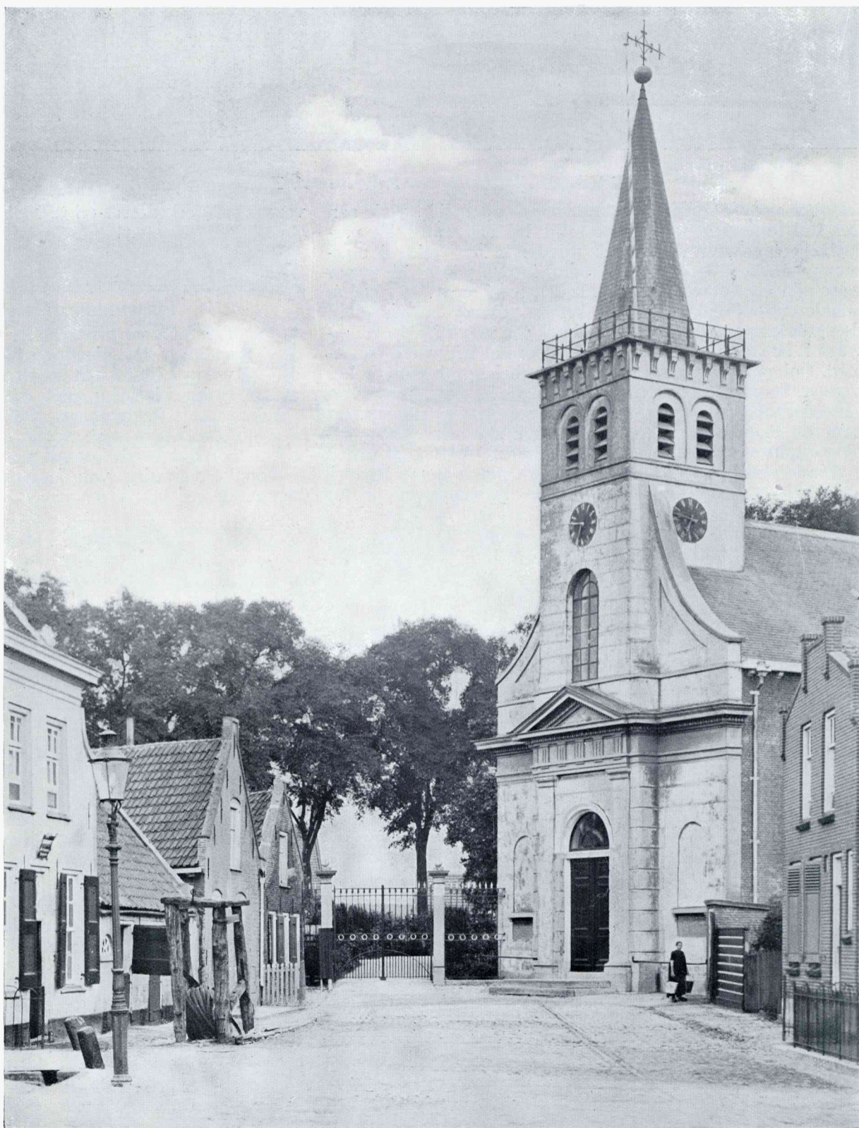
BIJ DE NED. HERVORMDE KERK TE OOLTGENSPLAAT

komstig te zijn van den bouwmeester die ook de gemeentehuizen van de Klundert en Bolsward bouwde. Dit Raadhuis is van 1616 en helaas in 1839 „opgeknapt", waaraan wij de leelijke ramen danken. Er is sprake geweest van restauratie in den oorspronkelijken stijl, waarna het gebouw tot museum zou worden ingericht en de gemeente door een groote gift in de gelegenheid zou worden gesteld, een nieuw gemeentehuis te bouwen, doch deze plannen zijn helaas afgesprongen. De topgevel is prachtig met de kleur van oude baksteen en verweerde natuurstenen ornamenten. Onder het Raadhuis was vroeger de Waag. ☼ Dat er niet méér oude gebouwen zijn, zal wel voor een deel te wijten zijn aan de groote overstromingen, die meer dan ergens anders hier hebben gewoed. In 1682 b.v. werd de geheele school benevens het huis van den onderwijzer en eenige andere woningen, aan den Kerkring gelegen, door het water vernield! Dat tenslotte het mooie Raadhuis bewaard is gebleven, zal zeker ook komen door de iets hoogere ligging; het haventje is menigmaal overstroomd en dan kwamen bij de huizen rondom de vloedplanken voor den dag! ☼ Door het steeds verzanden en aanslibben van de reede van De Plaat