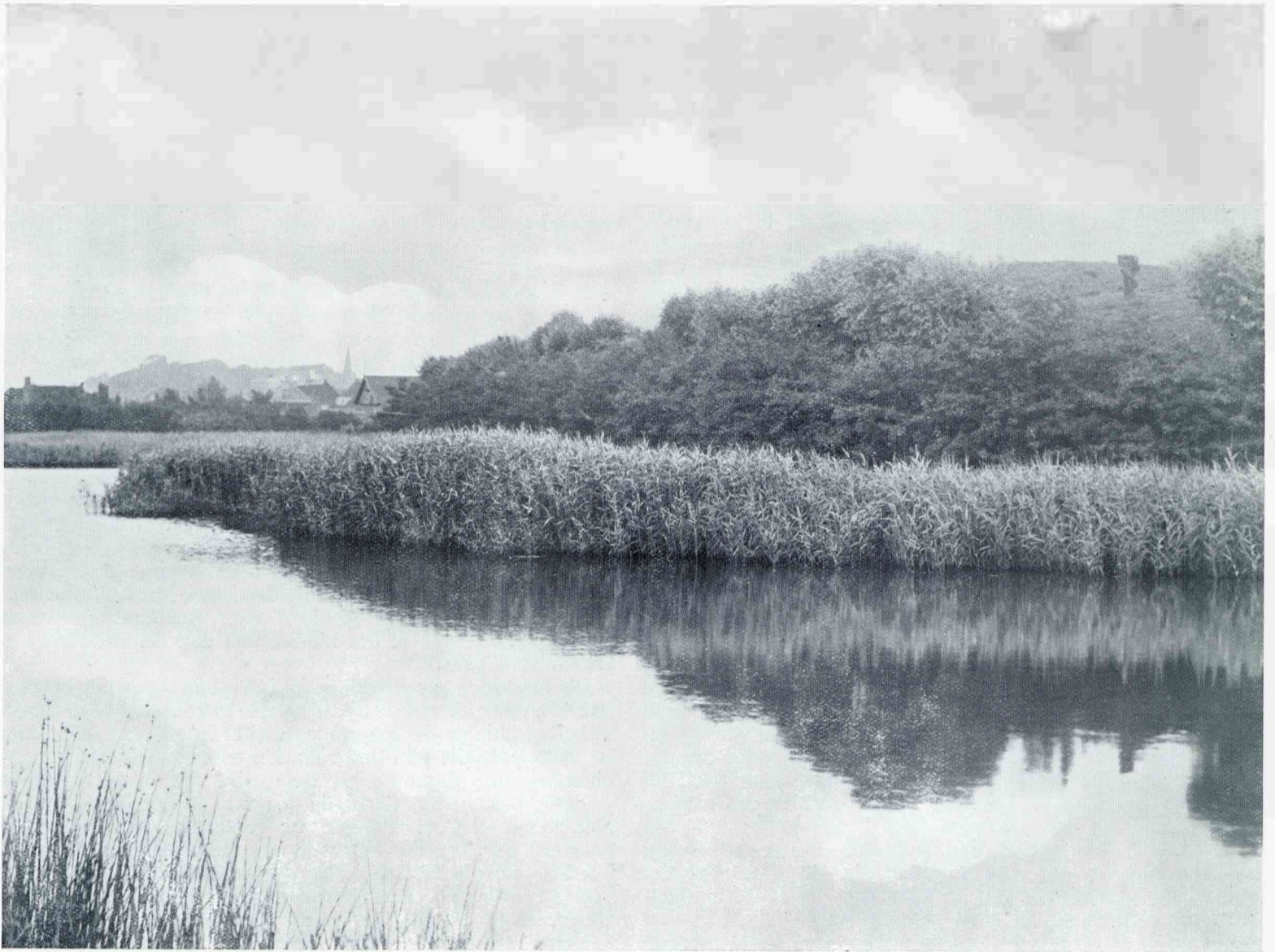
BIJ DE REDOUTE TE OOLTGENSPLAAT