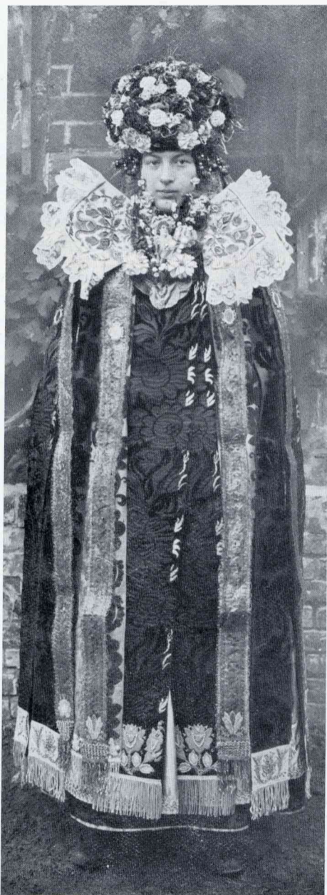
VAN BRUIDSKRONEN EN KROONBRUIDEN. MEISJE UIT BÜCKEBURG IN BRUIDSTOOI

verworven, en daardoor op een hooger plan als „Koning” der gemeenschap wordt verheven, is des te sterker door zijn verbintenis met een Koningin, een Meigravin, een Meiliefste. Koningschap en bruijgomsstaat versterken wederzijds de magische energie, welke er van het alom geeerde gilde-paar uitstraalt. ☞ En zoo verbaast de folklorist zich niet, wanneer hij in Limburg en den Gelderschen Achterhoek bij het vogelschieten koningsbruidjes ontmoet, die als te Lichtenvoorde, koperen kroontjes dragen en in hun driedaagsche kermisglorie de hulde van heel de gemeente in ontvangst hebben te nemen. De gekroonde bruid en vooral de gekroonde prinses, al is zij dan ook maar een ééndags schutters- of kermisprinses, draagt dan haar kroon als een symbool van de goddelijke macht, die in haar geïncarneerd is en die haar magisch naderbrengen tot de fantastische kindervoorstellingen der gekroonde feeën onzer sprookjes. En zoowaar vinden we in menige Scandinavische bruidskroon tusschen het zilveren loover drie vrouwenfiguren uitgebeeld, welke de drie zusters van het Lot, Ainbet, Wilbet en Worbet als schikgodinnen voor den geest roepen en die naast de booze-geesten werende spiegeltjes, hun zegen schenken aan zoo menig onder haar „kroonlast” gebukt gaand bruidje.