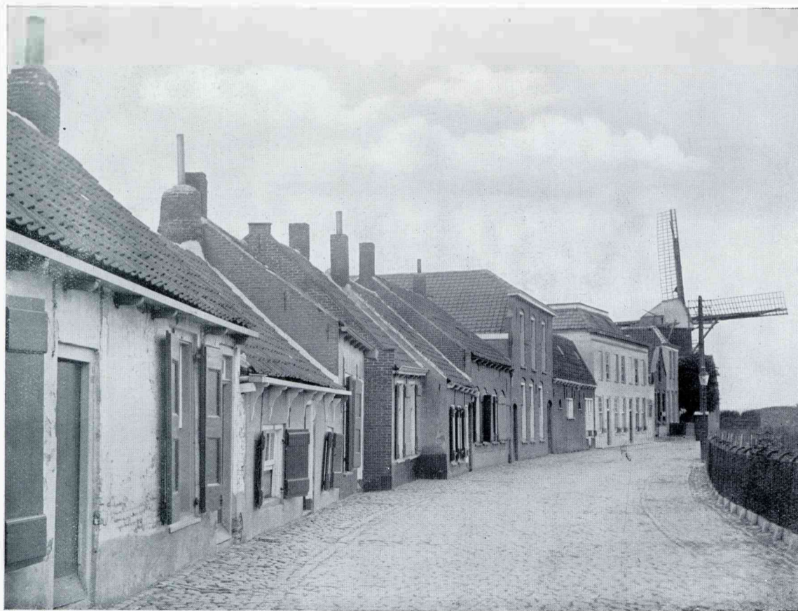
DE MOLENDIJK TE OOLTGENSPLAAT

blaadjes wijd en na twee uur sluit de bloem zich weer langzaam om aan het einde van den middag, al schijnt de zon ook nóg zoo stralend, niets meer te toonen dan een goed dichtgevouwen knop. De variëteit roseum heeft felrose bloemen. Verbazend gemakkelijk groeit de plant en is een sieraad, 's zomers ingegraven in den rotstuin, 's winters tusschen de andere Succulenten in kas, serre of huiskamer. Ook zeer kleine (maar natuurlijk sterke) stekken zijn al bloeibaar: dezen zomer droeg zoo'n hummel van geen 15 cm hoog welgeteld vier helder-rose bloemen tegelijk, die in grootte noch kleur onderdeden voor die van oudere planten. Natuurlijk is het welbekende systeem „'s zomers buiten" ook op deze plantengroep van toepassing. In tegenstelling met vele witberijpte of behaarde mede-Vetplanten kan Mesemb. roseum wel wat regen verdragen; te veel schaadt natuurlijk ook hier. Echter is het een sterk plantje, en er bestaat dan ook geen enkele reden voor om het niet