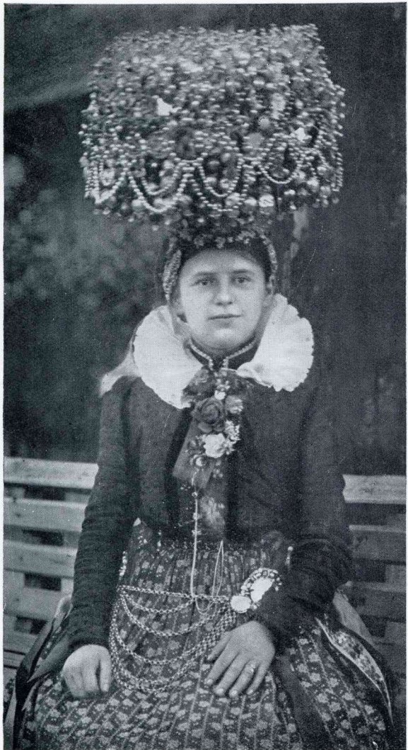
SCHWARZWALDER MEISJE MET BRUIDSKROON EN BRUIDSGORDEL