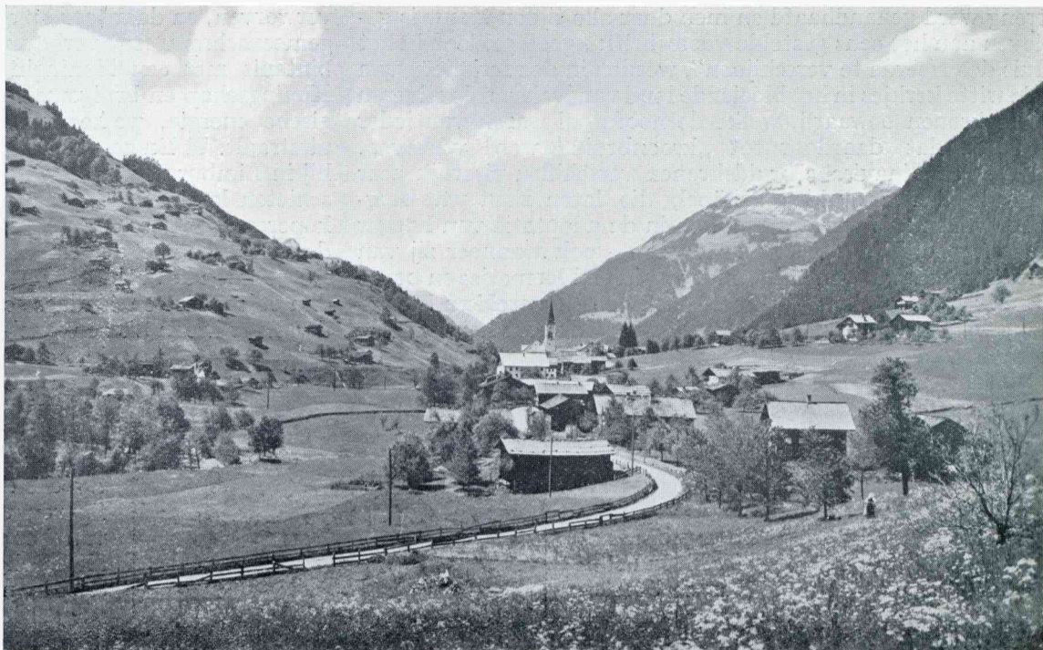
VORARLBERG MET HET MONTAFONER TAL. GASCHURN IN MONTAFON

omgeven is en vooral in een keldergat, dat met een regenafvoerbuys in verbinding staat, kan ik den geheelen winter door trage, in winterslaap, verkeerende kikvorschen en salamanders vinden. De omgeving moet steeds meer of minder vochtig zijn. In mijn kelder hangen in het late najaar duizenden muggen en onder eenige oude dakpannen bij een der vier groote schoorsteenen zijn steeds eenige kniezende vlemuisjes aanwezig. De dieren zoeken dus zelf dekking. De planten doen eigenlijk het zelfde, doch zij zijn niet zoo beweeglijk. Er zijn er, die al die deelen, die te vervangen zijn, en die voor het voortbestaan van het individu gevaarlijk zouden kunnen zijn, in het najaar van zich afschudden. De andere deelen zijn door de natuur beschermd; de stammen door de schors en de wortels door de steeds warmere aarde. Er zijn er ook, die de soort in stand houden door de kleinst mogelijke gestalte aan te nemen. De moederplanten sterven in het najaar geheel af, doch de zaden blijven in leven. Deze worden door afgevalven bladeren gedekt of worden door wind, water en dieren vervoerd naar veiliger plaatsen, waar zij in het voorjaar ontkiemen en weer volkomen op de moederplant gelijkende exemplaren opleveren. De natuur is wonderbaar mooi en