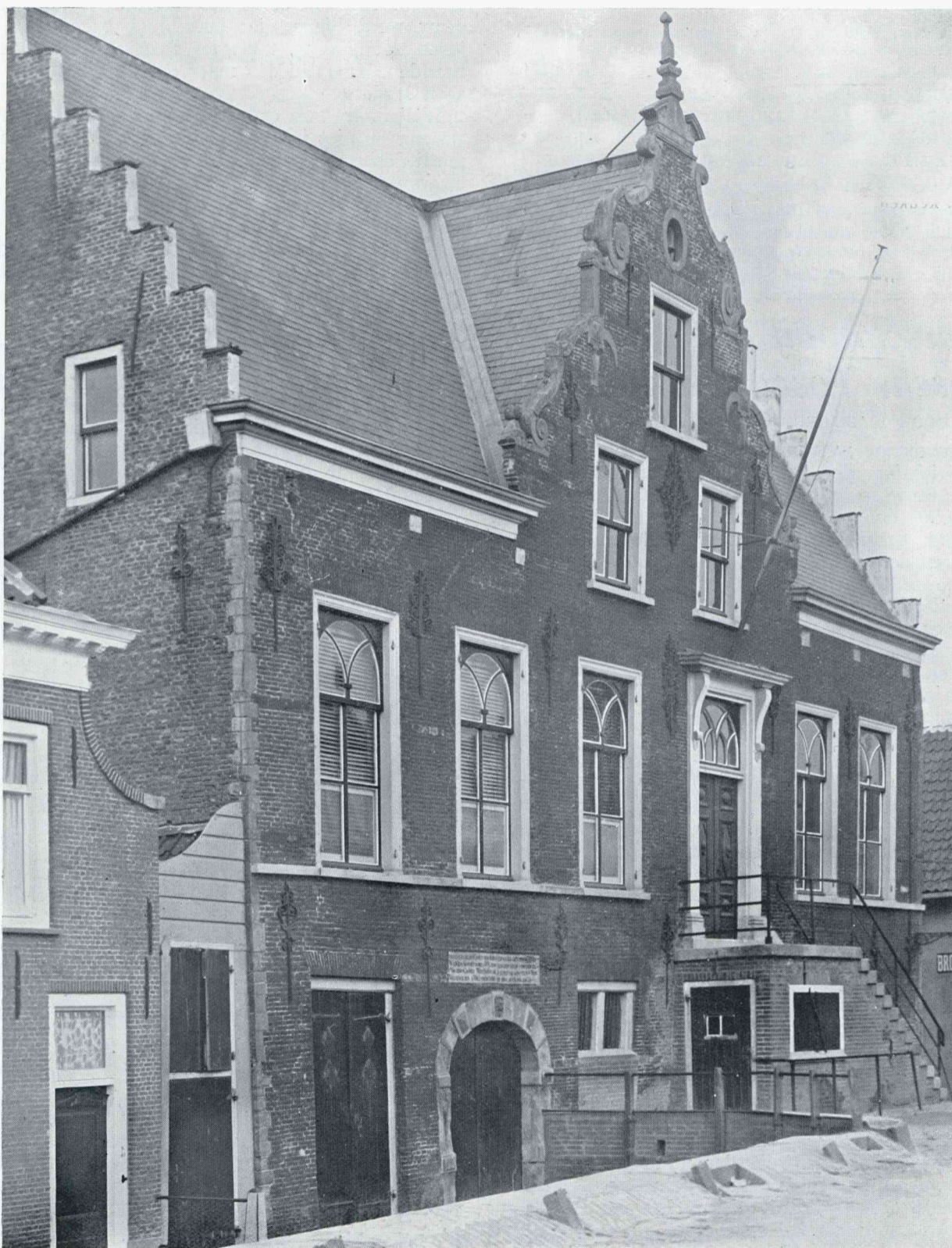
HET EILAND GOEREE EN OVERFLAKKEE. HET RAADHUIS VAN OOLTGENSPLAAT (1616)