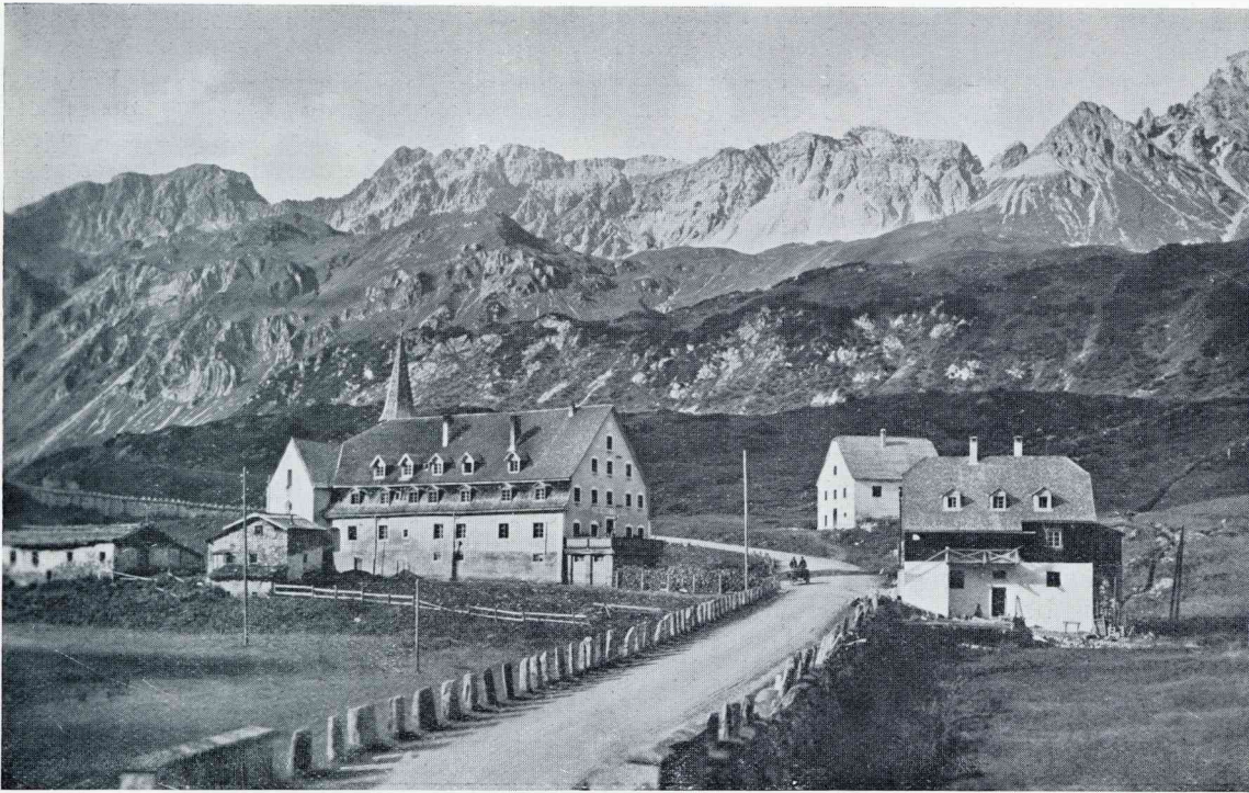
HET HOSPIZ ST. CHRISTOPH BIJ DEN ARLBERGPAS