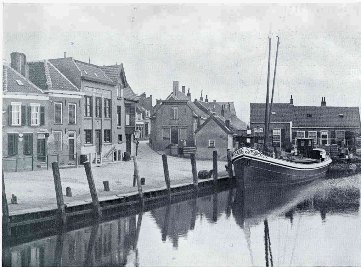
HET HAVENTJE VAN OOLTGENSPLAAT

was het voor de groote stoombooten ondoenlijk, vlak aan den wal te komen, vooral natuurlijk bij laag water. De pasagiers en goederen werden dan midden in het Volkerak afgezet op een klein bootje, wat vooral in den winter bij zwaar weer zijn eigenaardige moeilijkheden meebracht. In 1909 is aan dezen toestand een einde gekomen en kreeg Ooltgensplaat den grooten aanlegsteiger, terwijl ook een prachtige toegangsweg uit het dorp naar dien steiger door het Rijk werd aangelegd. Ooltgensplaat werd hierdoor een belangrijk punt in het verkeer langs en om de eilanden. Helaas is, door groote verzandingen bij den aanlegsteiger en in de rivier, alle verkeer over De Plaat thans stopgezet. ☞ Aan zijn strategische ligging dankte Ooltgensplaat ook zijn forten. In 1600 al waren er een schans en twee redoutes, en in 1792 is er een batterij aangelegd (van waar uit de Franschen zijn verdreven, en zó