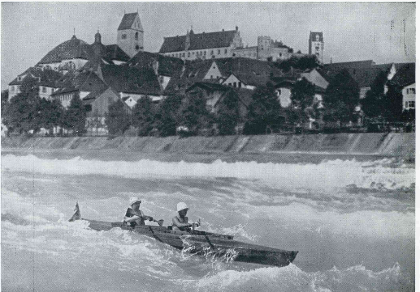
OP HET WILDE WATER VAN DEN LECHWEHRFALL TE FÜSSEN AAN DE LECH

Ontvangen Boek. De Reichsbahnzentrale für den Deutschen Reiseverkehr, Parklaan 28, Rotterdam, zendt ons een alleraardigst geïllustreerd boekje, getiteld „Wasserwandern in Deutschland”, dat in woord en beeld doet zien welk een groote plaats de watersport, in het bijzonder de canosport, tegenwoordig in Deutschland inneemt. Het boekje geeft talrijke gegevens over cano-reizen op de Deutsche stroom en meertjes en wordt verlucht door vele zeer fraaie foto's, terwijl achterin een uitstekende overzichtskaart van geheel Deutschland en een overzicht van de Ruderherbergen opgenomen is. De afbeelding op deze bladzijde is ontleend aan dit boekje, dat gratis aan bovengenoemd adres verkrijgbaar is.