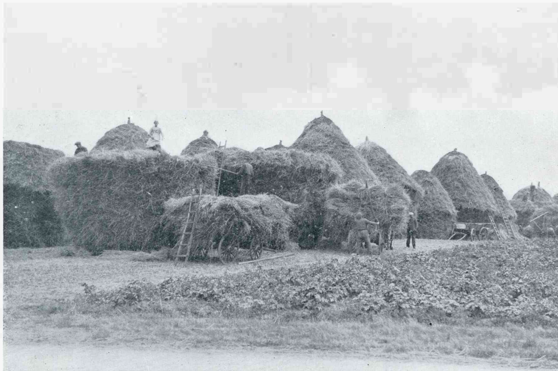
ALS DE KORENOOGST OP DE DRENTSCHE ESSCHEN IS AFGELOOPEN, BRENGEN DE BOEREN HET GRAAN BIJ ELKAAR OM HET GEZAMENLIJK MET DE MACHINE TE DORSCHEN

EEN oud liedje dat we ijverig en met toewijding zongen in onze jonge jaren, toen het voor ons een uitgemaakte zaak was dat Drenthe 't mooiste en beste deel van de wereld was. ☞ Ga eens met mij rondzwerven, dan wil ik u het mooie van ons landschap laten zien, dan wil ik u vertellen van het leven van hen die het bewonen. ☞ De weiden! Als een gouden deken bedekken de gele boterbloemen de groene weiden, hier en daar omzoomd door een roodachtig waas van de hooge zuurstengels, die licht wiegend op den adem van den wind, als goedkeurend hun pluimen naar den grond nijgen. ☞ In den tijd van zon en zomer, van blij, vol leven dat overal ons begroet, overgoten door de warme zonnestralen, als de dauwdroppels glinsteren in de morgenzon, als de vogels hun dag beginnen met uitbundig gezang, komen de mannen met hun blanke zeisen om het volle welige gras te maaien. ☞ Met forsche slagen snijdt het scherpe staal de sappige stengels en waar de groene, met goud doorsprenkelde