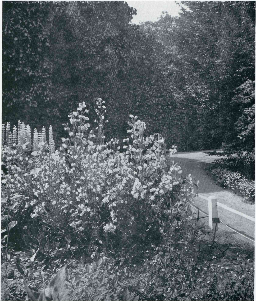
GROEP ANCHUSA'S (LINKS LUPINEN)