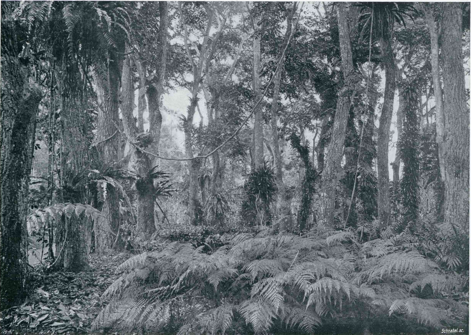
VARENGROEI OP DEN GROND EN EPIPHYTISCH (OP DE BOOMEN) IN DEN VARENTUIN TE BUITENZORG