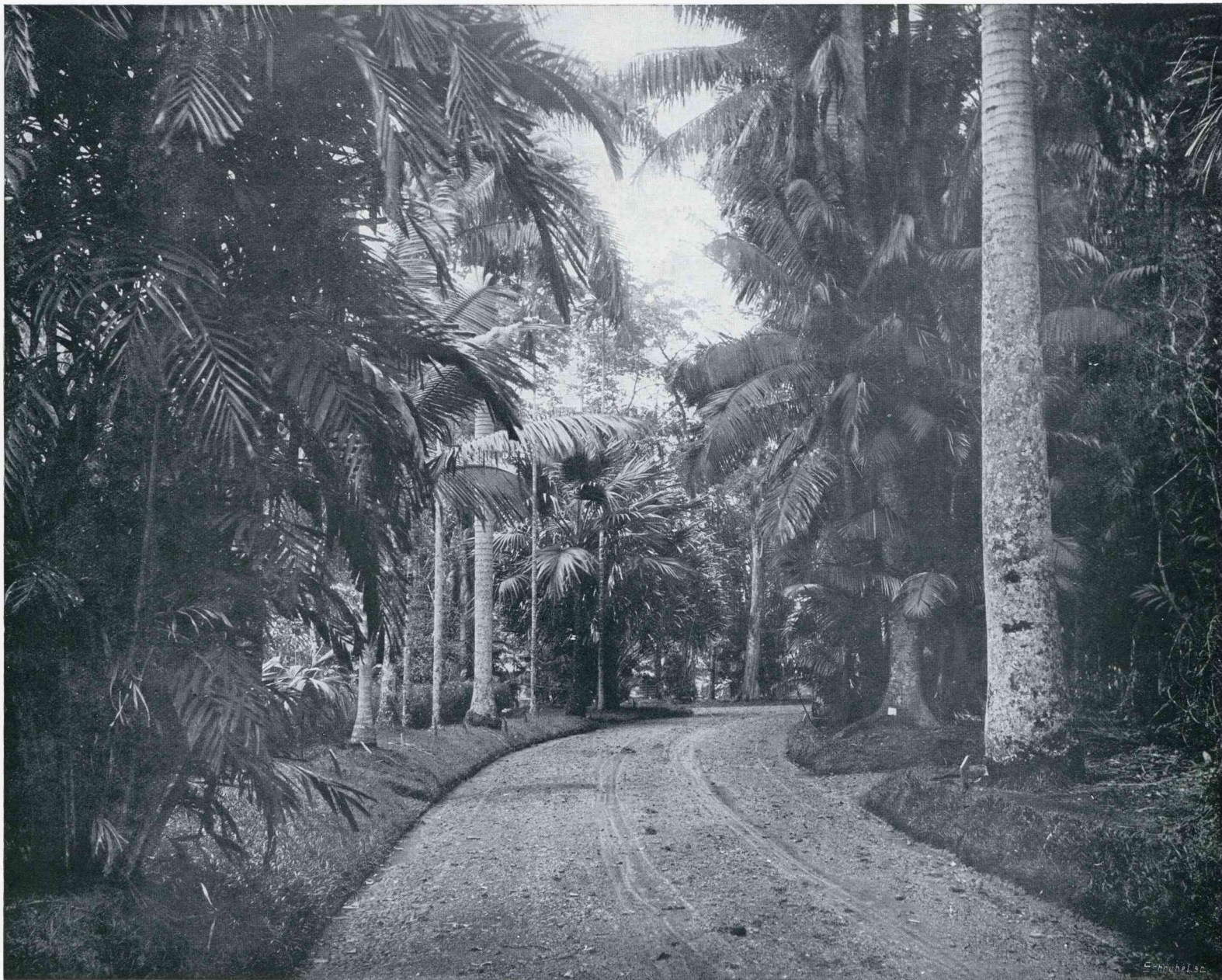
LAAN VAN KONINGSPALMEN IN DEN PLANTENTUIN TE BUITENZORG