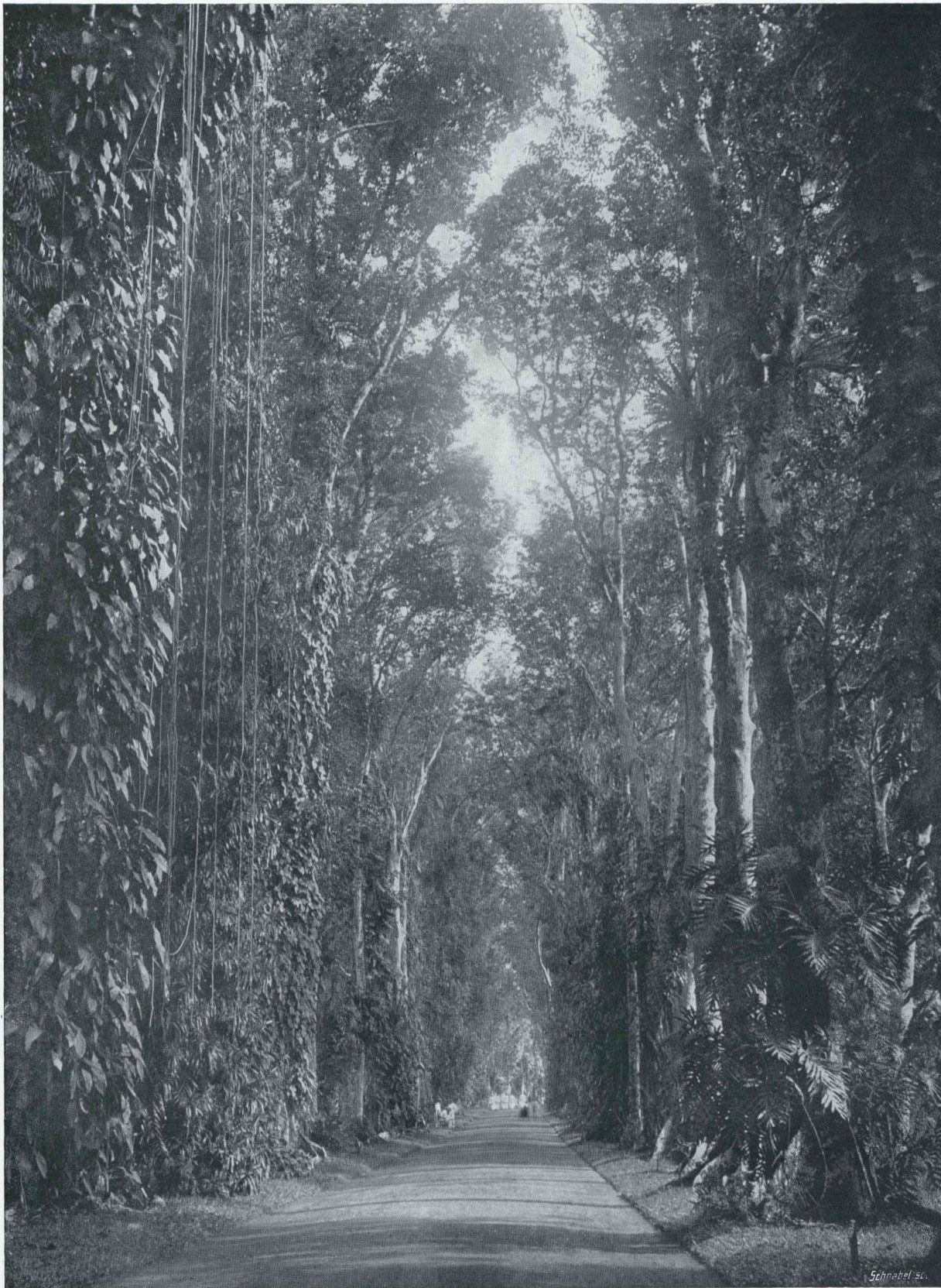
KLIMPLANTEN EN LIANEN IN DE „KANARIELAAN” VAN DEN BOTANISCHEN TUIN TE BUITENZORG