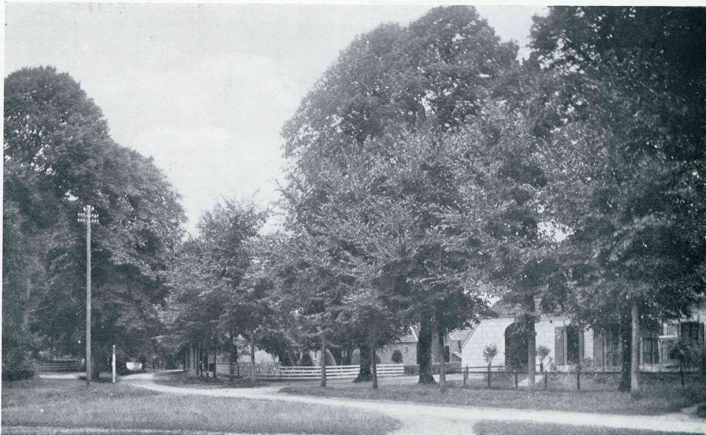
DE MOOIE BRINK VAN GIETEN

worden der zaden zoo spoedig mogelijk en dan liefst onder glas. Na den bloei sterven de planten spoedig af en kan men op de open plekken zoo hier en daar wat andere herfstbloeiende gewassen ertusschen zetten. Op de foto (zie vorige blz.) zien we de Alstroemeria Chilensis die men in vele kleuren aantreft, varierende van wit-geel tot licht en donkerrose. Een plant die men ook zeer weinig aantreft, en die toch al heel bijzonder mooi is, is de Asclepias tuberosa , met prachtige schermvormige oranje bloemen. De bloeitijd van dit gewas valt in Augustus-September. De bloemen vallen op door hun buitengewoon fraaie oranje kleur. Ze verlangt een plaats in de volle zon, en groeit het best op een goed losgewerkten grond. Ook deze plant moet 's winters een weinig gedekt worden, vooral als ze in het najaar geplant wordt. Tenslotte vragen we dan uw aandacht nog voor de zeer weinig bekende en toch zoo fraaie Incarvillea Delavayi met prachtige purper-rose klokvormige, op Gloxi-