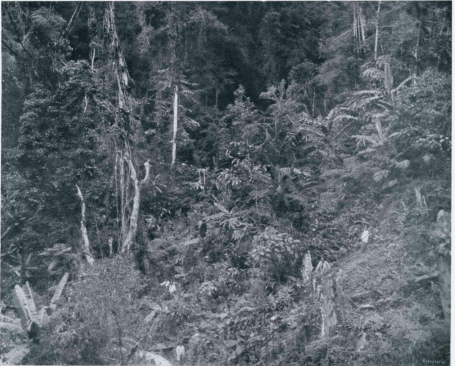
'S LANDS PLANTENTUIN TE BUITENZORG. OERBOSCH IN DEN OMTREK VAN BUITENZORG