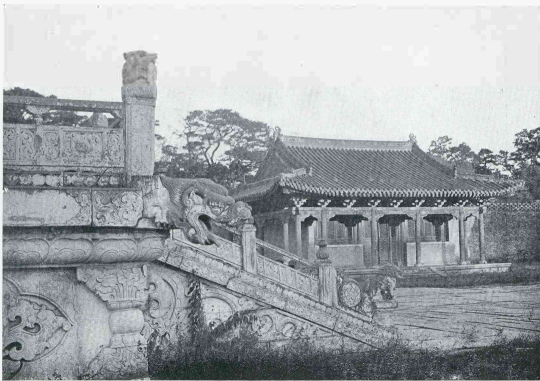
FAÇADE VAN EEN NAAR EEN BINNENHOF MET ONTVANGPAVILJOEN (RECHTS) LEIDENDE TRAP IN HET KEIZERSPALEIS TE MOEKDEN