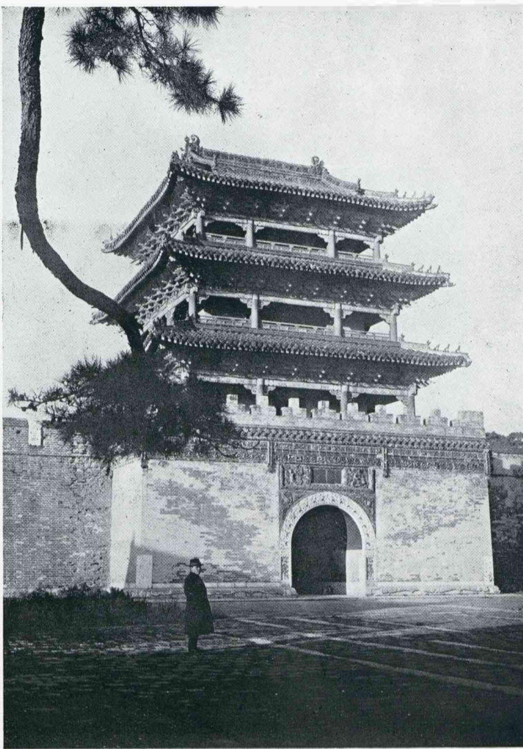
MOEKDEN. TOEGANGSPOORT TOT HET GRAF VAN NOERHATSJOE, DEN VADER VAN DEN EERSTEN MANTSJOE-KEIZER

king, angstvallig gesloten zijn. Zijn zij leeg? — die vraag dringt zich onwillekeurig aan mij op. Is er geen enkel meubelstuk, geen enkele versiering meer over, die aan het grootsche