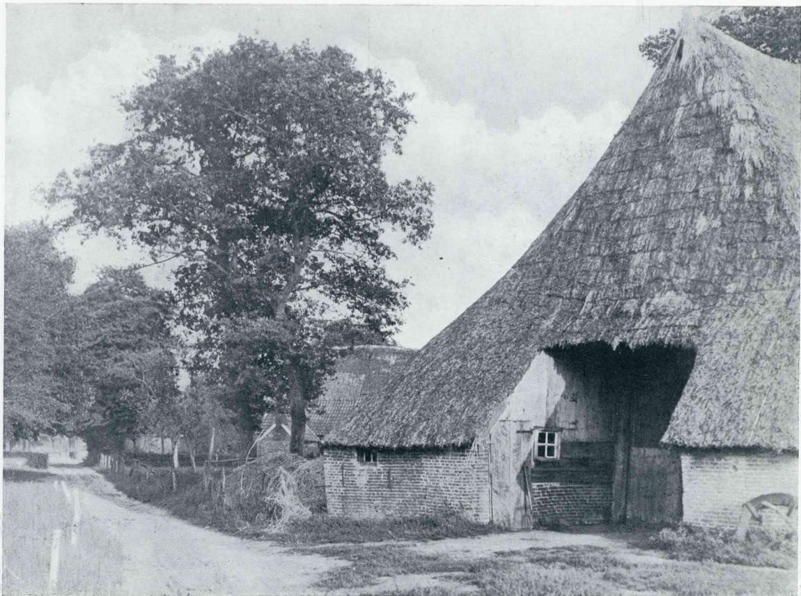
DE BAANDERDEUREN MET BAANDERHOEK VAN EEN BOERDERIJ TE GASSELTE

het dorschen werd het stroo weggenomen, de korrels bij elkaar geveegd en in een „wan” voorzichtig geschud om de overblijfsels van de aren er uit te halen. Later werd het in een wadmolen (waaier of weijer) beter schoongemaakt. ☼ Hiermede verdienden veel arbeiders des winters hun brood. ☼ Nu wordt het koren buiten het dorp in „mijten” of „zaadbulten” gezet om straks als alles binnen is door de stoomdorschmaschine afgedorscht te worden, terwijl het stroo in pakken wordt geperst. ☼ Als men na den oogsttijd zoo'n verzameling korenmijten ziet, zou men meenen in de binnenlanden van Zuid Afrika te zijn, zoo gelijken deze korenhooopen op kafferwonin-