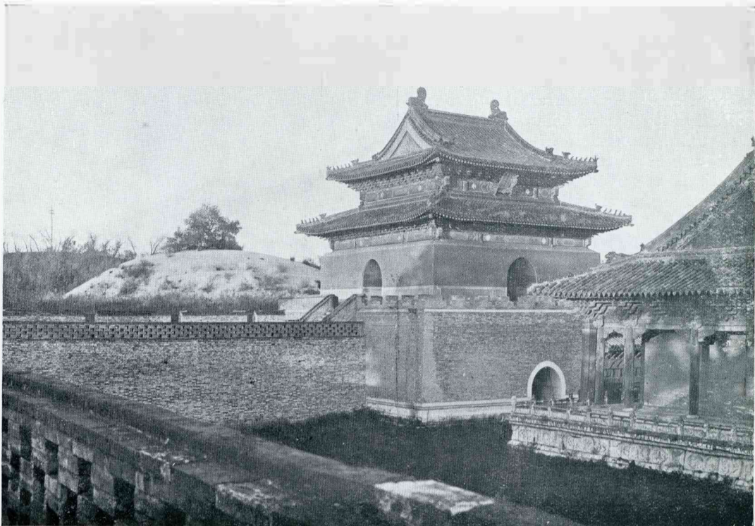
HET GRAF VAN NOERHATSJOE, DE VADER VAN DEN EERSTEN MANDSJOE-KEIZER, BUITEN MOEKDEN

Piron zeide, dat geestige menschen graag goed mochten eten, merkte Voltaire op: „Zoozoo, u eet daarom zeker graag zoo goed, omdat U geestig wilt zijn?” ☞ Toen de première van een van Voltaire's toneelstukken in het water gevallen was, voegde Piron hem toe: „Nu, monsieur Voltaire, dezen keer wilde U zeker wel, dat het stuk van mij was!”