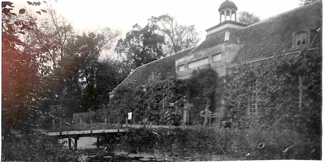
HET KASTEEL WESTHOVE. DE ORANJERIE