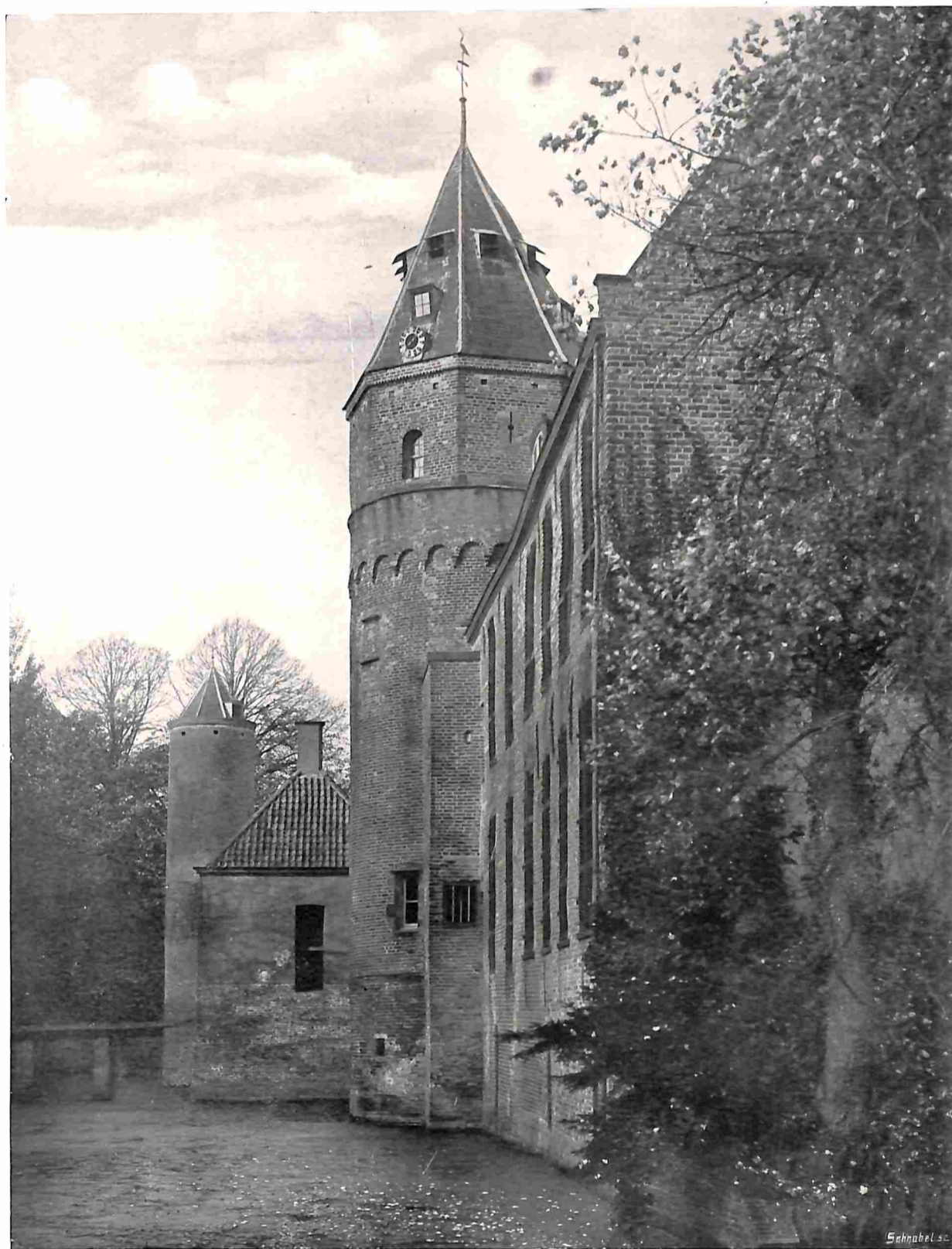
HET KASTEEL WESTHOVE BIJ OOSTKAPELLE OP WALCHEREN, GEZIEN VAN DE NOORDWESTZIJDE (BIJ HET ARTIKEL: „HET KASTEEL WESTHOVE”)