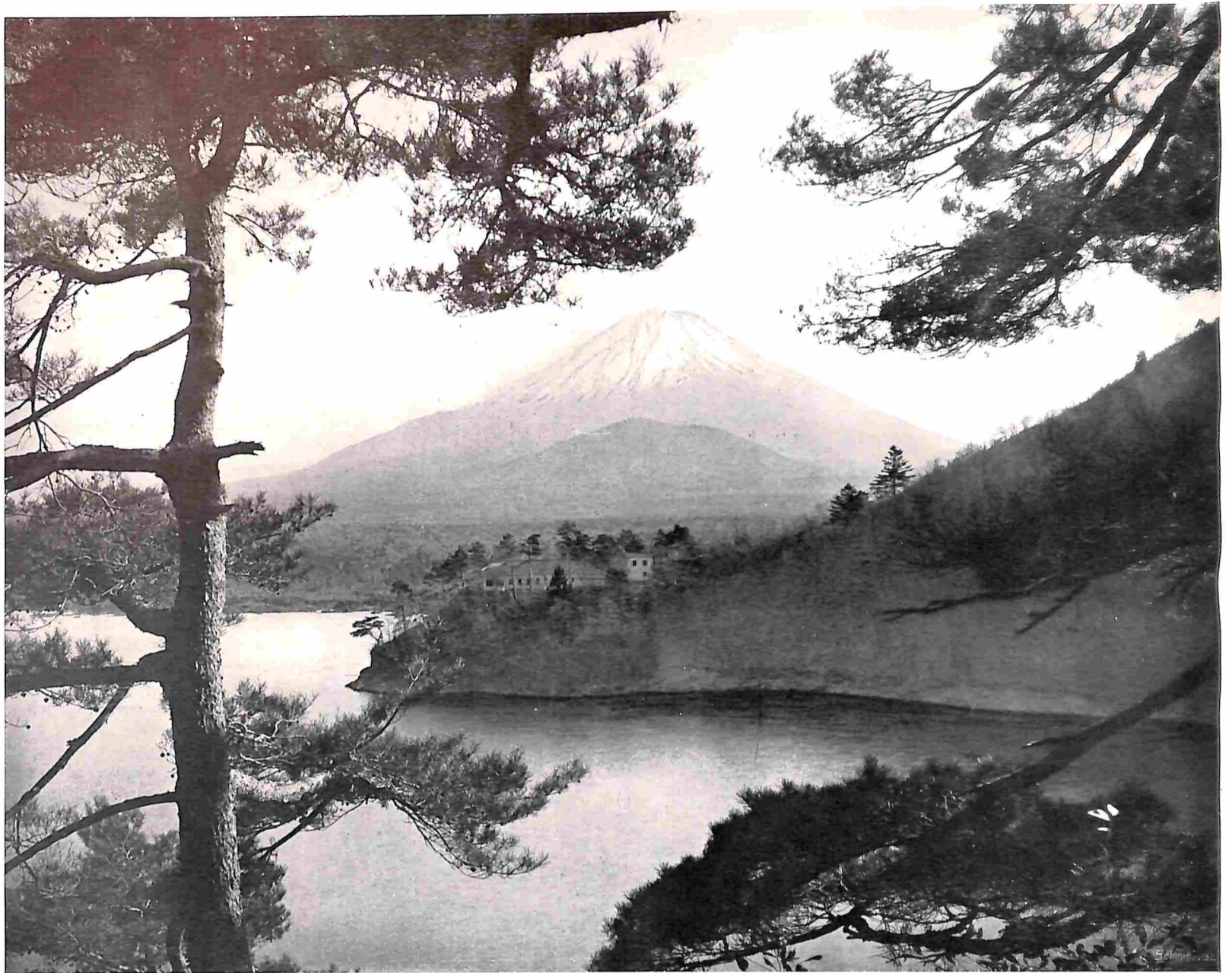
JAPAN'S HEILIGE BERG, DE FUJIJAMA