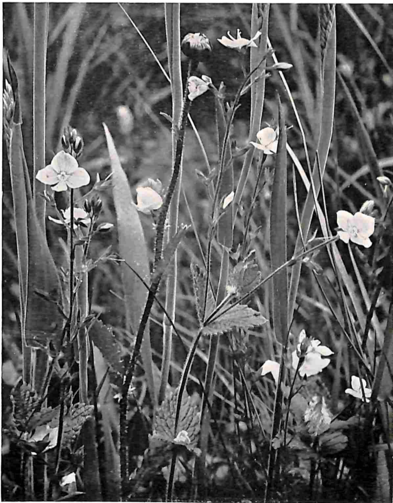
EEREPRIJS AAN DEN WEGKANT

M ET spanning wachten we ieder jaar in Februari en Maart op de eerste, zonnige lentedagen. Soms, zooals van 't jaar, brengt de Sprokkelmaand ze in overvloed, maar dan wordt het in Maart weer guur en koud, zoodat alle speculaties op een vroeg voorjaar schijnen te mislukken en plannen voor de Paaschdagen door hagel en sneeuw worden verijdeld. Ook gebeurt het wel dat midden Maart reeds de lente in het land is, dan schiet alles met een vaart uit den grond, groeipiepjes ontplooiën zich snel, veel te snel, de boomen staan in blad voor we er ons goed rekenschap van geven en in de vruchtboomen bloesemt het reeds midden April. Ook dit is in ons land meestal fataal, want immer neemt de natuur dan weer terug wat ze ons zoo vroeg kwistig toebedeelde en veel gaat er dan verloren door hagel en late kou. Het kan echter ook gebeuren dat we moeten wachten tot midden Mei. Dan lijkt de lente een vertraagde film en bloeit, zonder opeenvolging, plotseling alles tegelijk, zoodat er buiten wél een overvloed van bloeiende planten te vinden is, maar het bijna onmogelijk wordt de verschillende