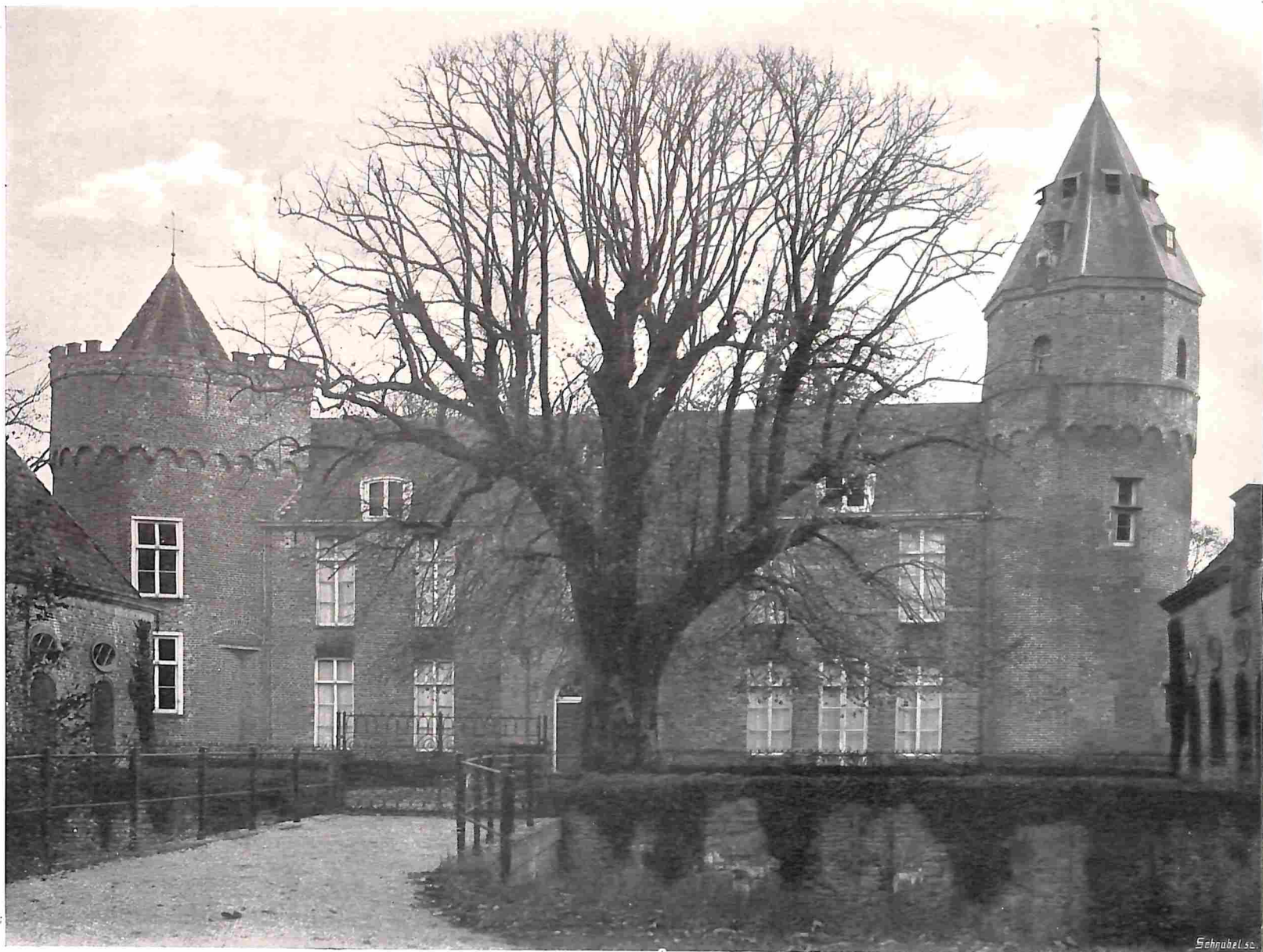
KASTEEL WESTHOVE BIJ OOSTKAPELLE — VOORZIJDJE