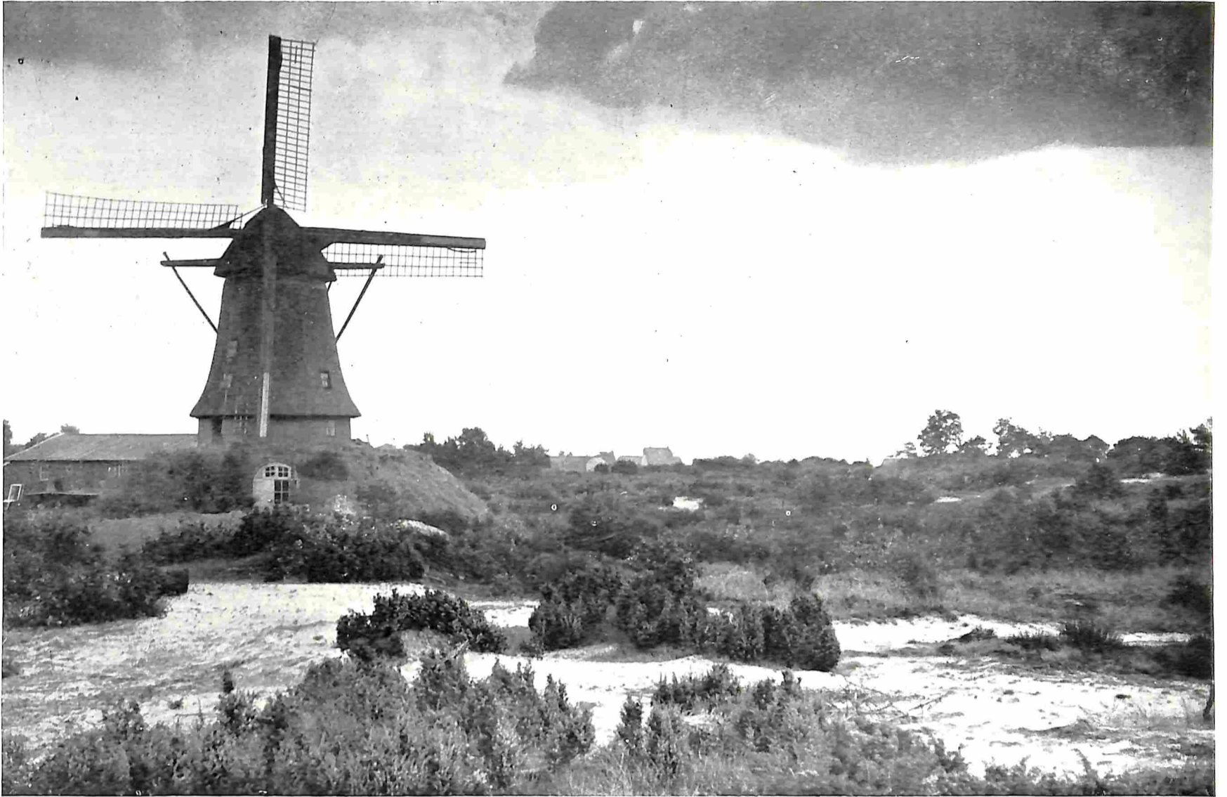
KORENMOLEN (BELTMOLEN) OP DE HEIDE BIJ MARIENBERG (OV.)