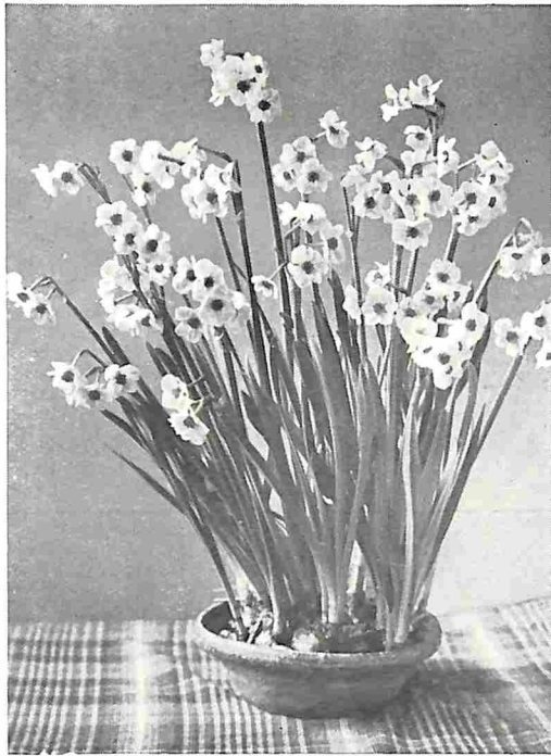
POETAZ-NARCISSEN ORANGE CUP, GEEL MET DONKER ORANJEROOD KROONTJE

natuurlijk regelmatig vochtig houden. ☼ Van de Trompet-Narcissen noemen we als goede verscheidenheden: Golden Spur, goudgeel, een van de beste; King Alfred, geel, groote bloemen; Mrs. E. H. Krelage, wit, en Olivier Cromwell, gele trompet en wit bloemdek. ☼ Van de kortkronige zijn de volgende verscheidenheden aanbevelingswaardig: Sir Watkin, geel met oranje-gele kroon; Yellow Poppy, geel; Helios, geel, kroon licht oranje; Croesus, zwavelgeel met oranje-rood kroontje; Lord Kitchener, ivoor-wit; White Lady, zilver-wit; Orange cup, tros-Narcis.