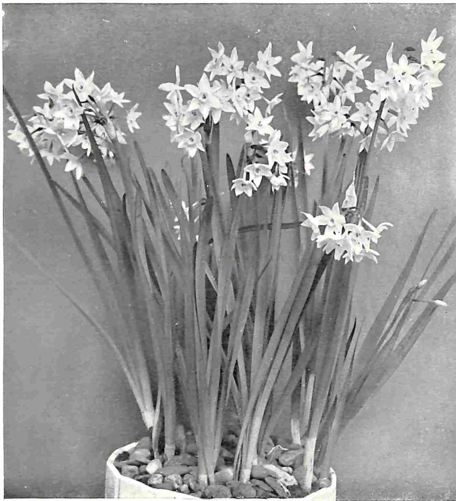
TROSNARCIS PAPERWHITE GRANDIFLORA (KERSTMIS-NARCIS)

paraten, van sanitair en huistelefoon, die zij wel willen aanvaarden, maar voor de rest blijven zij zweren bij het oude. Het zijn de menschen met de grondgedachte dat al het oude goed en het nieuwe stellig verkeerd moet zijn en zij maken zich al boos wanneer men over „modern” begint. Zij vinden al in de benaming iets aanmatigends, iets zonder gevoel en zonder romantiek. Vooral het nieuwe landhuis vinden zij dwaas, blikkerig en zich niet aanpassend aan de omgeving. Zij wijzen dan op de tradities en geijkte constructies bij alles wat maar buiten heeft gebouwd, op de oude buitenplaatsen en boerenwoningen, het