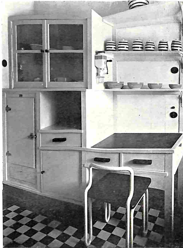
KEUKEN IN EEN LANDHUIS OP CRAILOO-BLARICUM (Architect F. Hausbrand)

vooral op de foto op de volgende bladz. prachtig te zien is. Pas als we het nest tot op enkele tientallen meters genaderd zijn, vliegt het wijfje, dat blijkbaar bezig was met het voederen der jongen, verschrikt weg. Maar al den tijd, dat we bij het nest blijven om de wollige jongen te bewonderen, zweeft ze boven onze hoofden. Helder en uitdagend klinkt de alarmroep, een hoog en schel kikikiki, dat wel