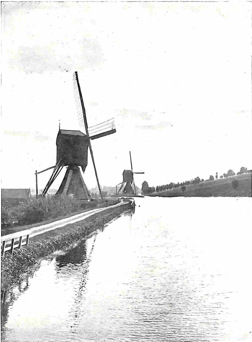
WIPMOLENS AAN DE SCHELLUINSCH E VLIET (ALBLASSERWAARD)

geen zeilen, wel iets van zijn schilderachtig aspect verloren. De technische voordeelen der zelfzwichting en het zoo ver mogelijk doorgevoerde stroomlijnprincipe — de zelfzwichting brengt een constante, zich zelf regelende snelheid mede — zijn natuurlijk aanzienlijk te noemen, zoodat het te begrijpen valt, dat de gebruikers er van ook dit systeem roemen. Ten slotte mag de hoop worden uitgesproken, dat ook dit systeem er toe zal bijdragen om het voortbestaan van den Hollandschen windmolen te verzekeren. ☼ In elk geval heeft Holland in de wereld met deze nieuwe opkomst van den windmolen opnieuw zijn naam als molenland bevestigd. Van Cuba, Madagascar, Amerika en meer landen kwamen aanvragen om bouwplannen (!), terwijl het een Nederlandsche molenbouwer was, die den verwaarloosden molen te Groote Schuur in Zuid-Afrika — den eenige die er nog was! — grondig herstelde. ☼ In het volgend artikel gaan wij dieper op de economische beteekenis van den windmolen in. (Wordt vervolgd)