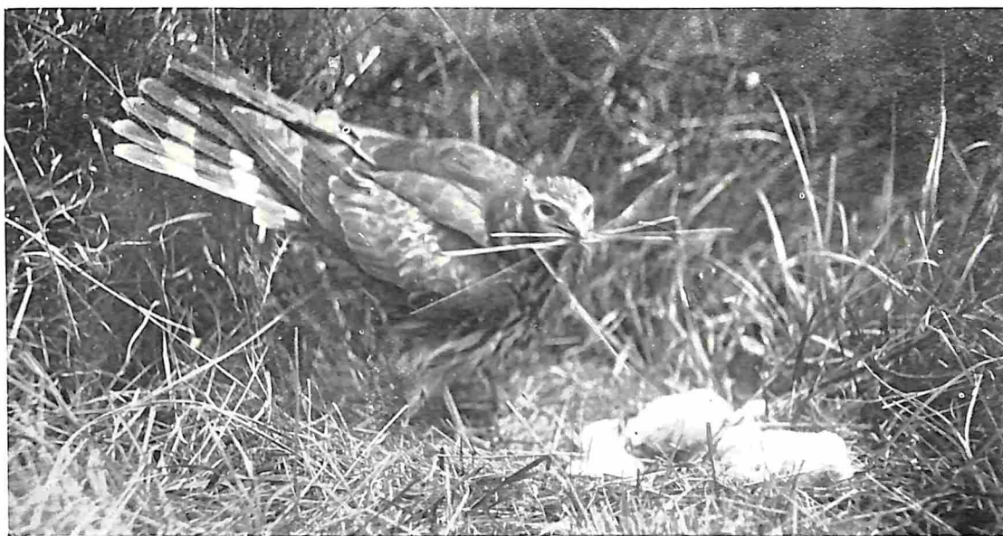
GRAUWE KIEKENDIEF (WIJFJE) BIJ HAAR DONSJONGEN