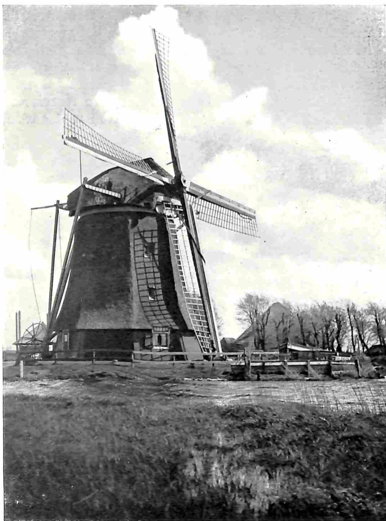
„DE SLOKOP”, EEN ACHTKANTIGE BOVENKRUIER AAN DE LIEDE BIJ HAARLEM