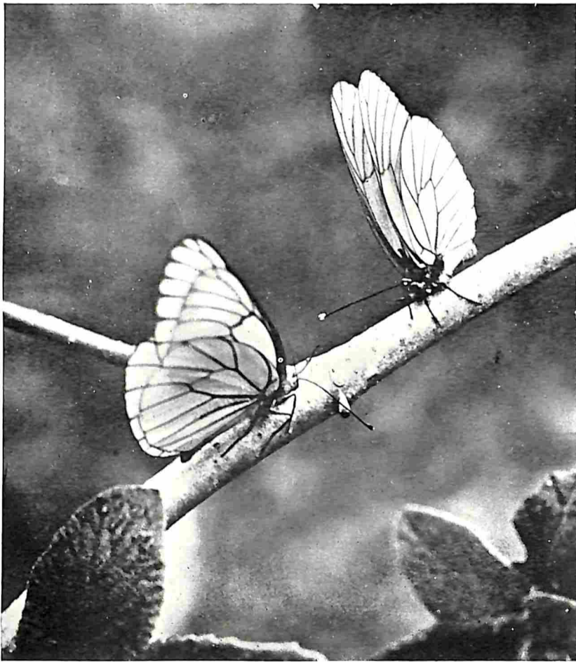
GROOTE GEADERDE WITJES

zwart van de vleugels. De andere soort is veel lichter geel en heeft minder donkere randen, waardoor hij aanmerkelijk in pracht inboet. De rupsen leven op luzerne, wat hun voorkomen beperkt tot de streken waar dat gewas verbouwd wordt.