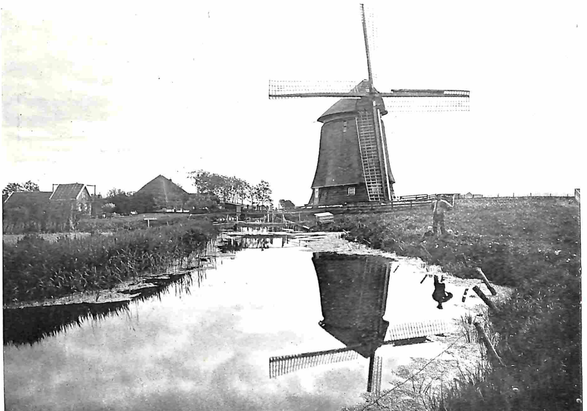
ACHTKANTIGE BOVENKRUIER IN DE EGMONDER MEER

geen zeilen, wel iets van zijn schilderachtig aspect verloren. De technische voordeelen der zelfzwichting en het zoo ver mogelijk doorgevoerde stroomlijnprincipe — de zelfzwichting brengt een constante, zich zelf regelende snelheid mede — zijn natuurlijk aanzienlijk te noemen, zoodat het te begrijpen valt, dat de gebruikers er van ook dit systeem roemen. Ten slotte mag de hoop worden uitgesproken, dat ook dit systeem er toe zal bijdragen om het voortbestaan van den Hollandschen windmolen te verzekeren. ☼ In elk geval heeft Holland in de wereld met deze nieuwe opkomst van den windmolen opnieuw zijn naam als molenland bevestigd. Van Cuba, Madagascar, Amerika en meer landen kwamen aanvragen om bouwplannen (!), terwijl het een Nederlandsche molenbouwer was, die den verwaarloosden molen te Groote Schuur in Zuid-Afrika — den eenige die er nog was! — grondig herstelde. ☼ In het volgend artikel gaan wij dieper op de economische beteekenis van den windmolen in. (Wordt vervolgd)