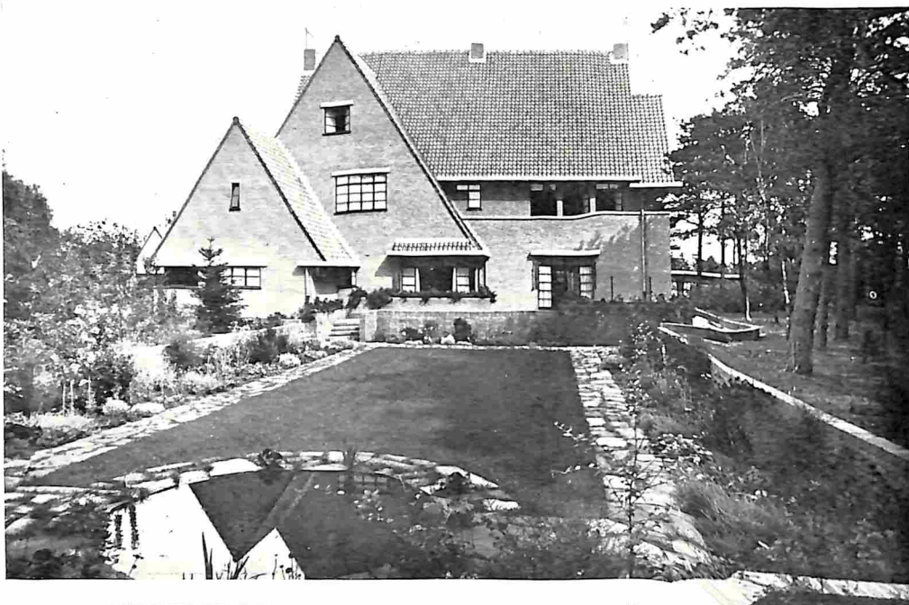
ACHTERZIJDE VAN EEN LANDHUIS OP CRAILOO-BLARICUM (Architect F. Hausbrand)