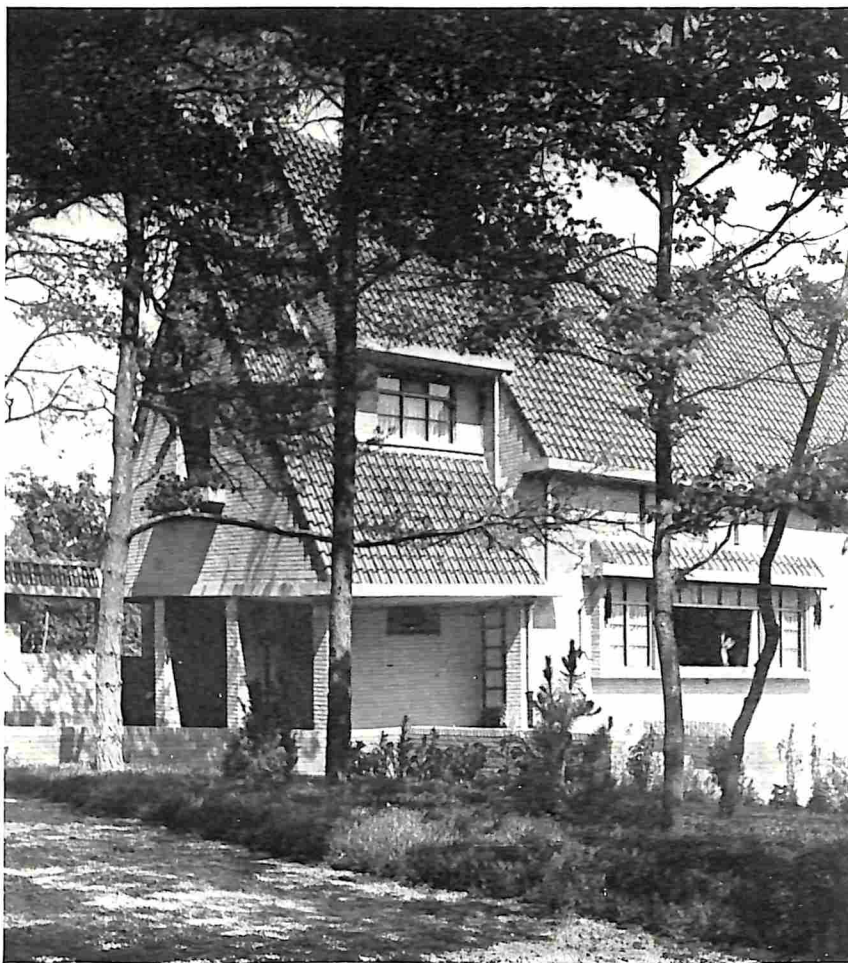
LANDHUIS OP CRAILOO-BLARICUM (Architect F. Hausbrand)

vooral de afweer naar buiten uit te drukken. Ook werden zware luiken toegepast en andere beveiligingsmiddelen van het boerenhuis afgezien. Waar nu de middelen van verkeer zooveel verbeterd zijn, waar treinen, autobussen, auto's en fietsen zorgen voor gemakkelijke verbinding en openbare veiligheid niets te wenschen overlaat, is een dergelijke demonstratieve afweer niet meer noodig, eigenlijk een beetje belachelijk; waar extra beveiliging toch nog wordt gewenscht, kan gebruik worden gemaakt van houten of stalen rolluiken, die gemakkelijk kunnen worden weggewerkt en dus zonder ridderlijk vertoon de inwoners beschermen. ☼ Het gevaar van het groote raam schuilt weer in de overdrijving, in een soort glasmanie. De leuze „meer licht” is bij moderne landhuizen wel eens overdreven door gehele wanden van onder tot boven van glas te voorzien, waardoor het verwarmen op zeer koude dagen bijna onmogelijk wordt en er onvoldoende wand voor meubelplaatsing overblijft. ☼ Inplaats van de oude luiken, blinden en leelijke zonneschermen zijn