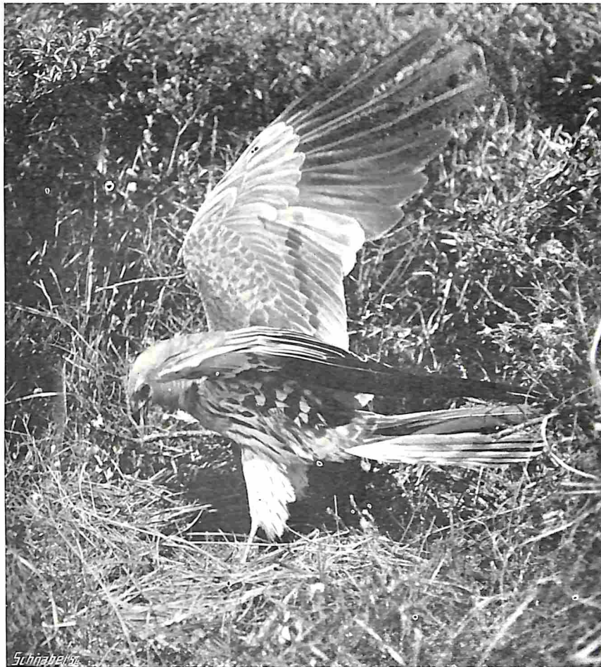
GRAUWE KIEKENDIEF (MANNETJE) NEERSTRIJKEND OP HET NEST

verschijnsel voor, dat deze vogels, welke toch alle vier eenzelfde uitgangspunt hebben, in twee totaal verschillende richtingen wegtrekken. ☼ Twee jongen, welke 4 Juli in de Geul geringd waren, werden resp. 17 en 18 Augustus, dus ruim een maand later, op den Z.O. trekweg neergelegd. De eerste bij Melnik, 30 km. N. van Praag, de tweede bij Heltershausen in Thüringen. ☼ De andere twee werden teruggemeld uit Wardreques, Dpt. Pas-de-