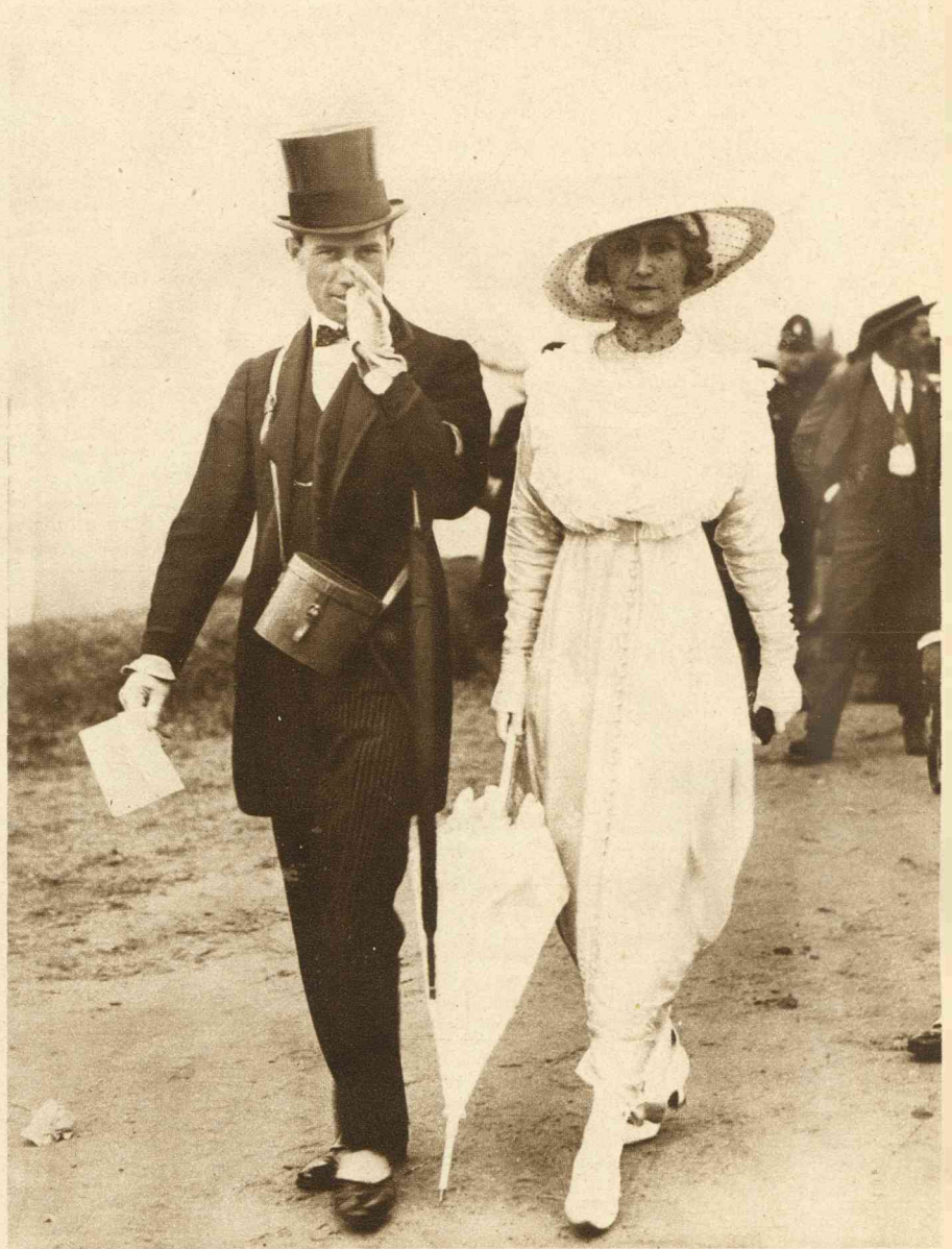
DE NIEUWE MODES IN ENGELAND. OPNAMEN BIJ DE WEDSTRIJDEN TE ASCOT