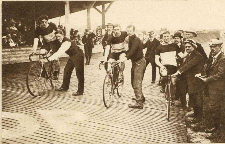
ULYSSES, DIDIER EN HOL.