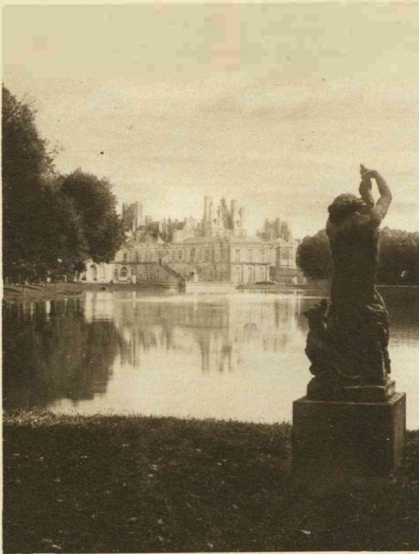
HET PALEIS TE FONTAINEBLEAU.

Geldt dit evenwel voor den architectonischen totaal-