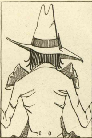
Sander als artist opgetuigd.

op, alsof ze iets verwachtten. En werkelijk ze verwachtten ook iets. Sedert het uur, waarop ze, twee dagen geleden, het zelfportret bij den kunstkooper hadden laten bezorgen met de boodschap „enkel maar afgeven”. Wat echter? Ja, wat verwachtten zij? In elk geval het zelfportret terug met of zonder brutale terechtwijzing, zoo iets van: dat zoo'n Magnus, uitgeslagen kerel als hij was, zich niet in de luren leggen liet met een Savoyekool, dat zulk een gepokte en gemazelde kunstkenner een zelfportret als het onderhavige niet voor zoete koek op bliefde te eten, noch eenig ander kunststuk van dien aard met het gezonden kunststuk dacht uit te richten.