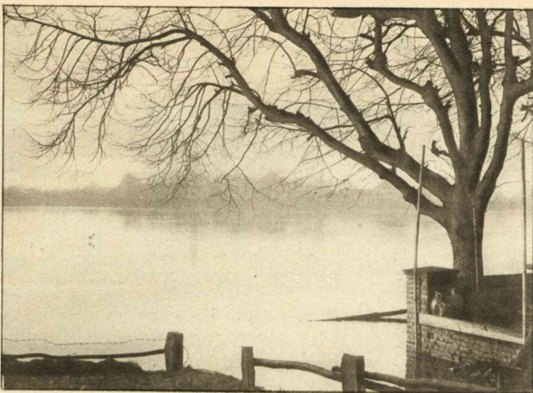
HOOG WATER. De landerijen aan de Maas zijn wederom door deze rivier overstromd. Onze foto geeft een kijkje bij het dorp Katwijk.

„Welnu, wat zou dat!” vervolgde Piet. „Ouwe Sam is drie en zeventig en hij werkt nog wel. En dan die smoessies van vader dat 'ie doof is en niet zien kan. Gooi eris een