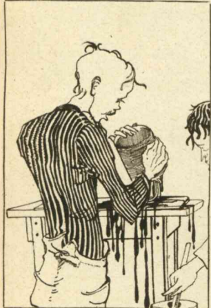
En hij wierp een landschap op het doek.

„Wat doe je daar?” vroeg hij Bram, die den kwast wilde indooopen. „Nonsens, overbodig. Het gaat beter zonder kwast. Een, twee, drie, hup!”