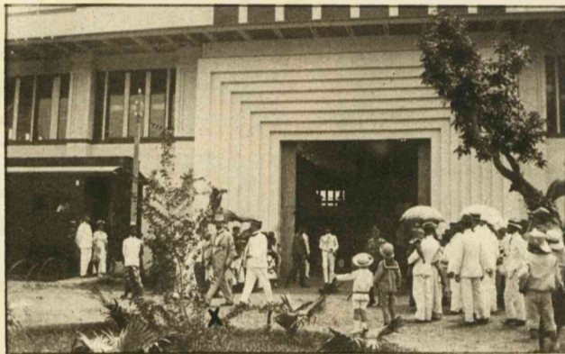
DE KOLON. TENTOONSTELLING TE SEMARANG. Gouverneur-Generaal Idenburg verlaat het Gebouw voor Inheemsche Nijverheid.