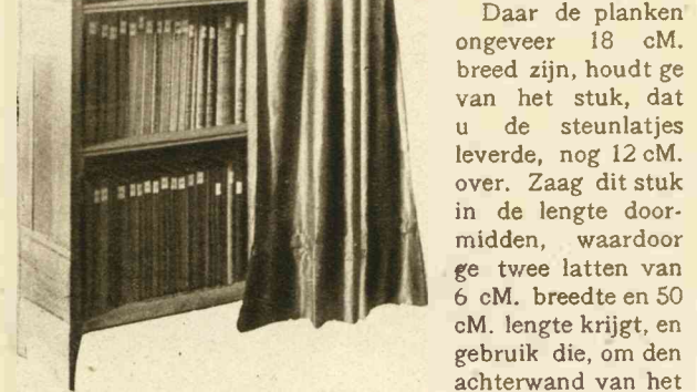
Fig. II. De pootjes en de bekleding met sigarenkisthout.

Nu nemen we eerst de zijplanken onderhanden. Wij hielden een halven meter hout over. Daarvan zaagt ge vier reepen van iets minder dan 1 1/2 cm. breedte, en deze reepen weer in tien latjes van 15 cm. lengte; zij zullen u dienen als steunlatjes voor de 5 plankjes, waarvan er 4 boeken torschen. Deze latjes nu bevestigt ge door middel van houtschroeven, drie voor ieder latje, aan de binnenzijde der zijwanden, op gelijke afstanden, na ze eerst aan één uiteinde te hebben afgerond, eerst ruw met de zaag, daarna met de vijl (Zie de foto, fig. I).