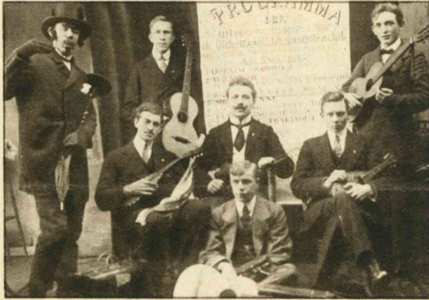
VOOR ONZE MILITAIRES.

Ik zie niet het minste verband tusschen gebakjes en liefde. Gebakjes zijn heerlijke dingen, terwijl liefde, voor zoover ik er wel eens van gehoord heb, zoo iets is als kiespijn.