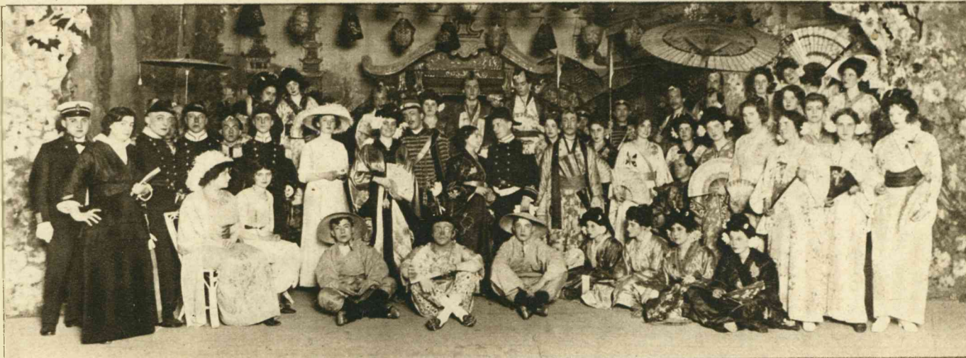
VOOR HET STEUNCOMITÉ.

„Nu, de zaak is...” hier ging zijn stem in een gefluister over, „ik ben verliefd!”