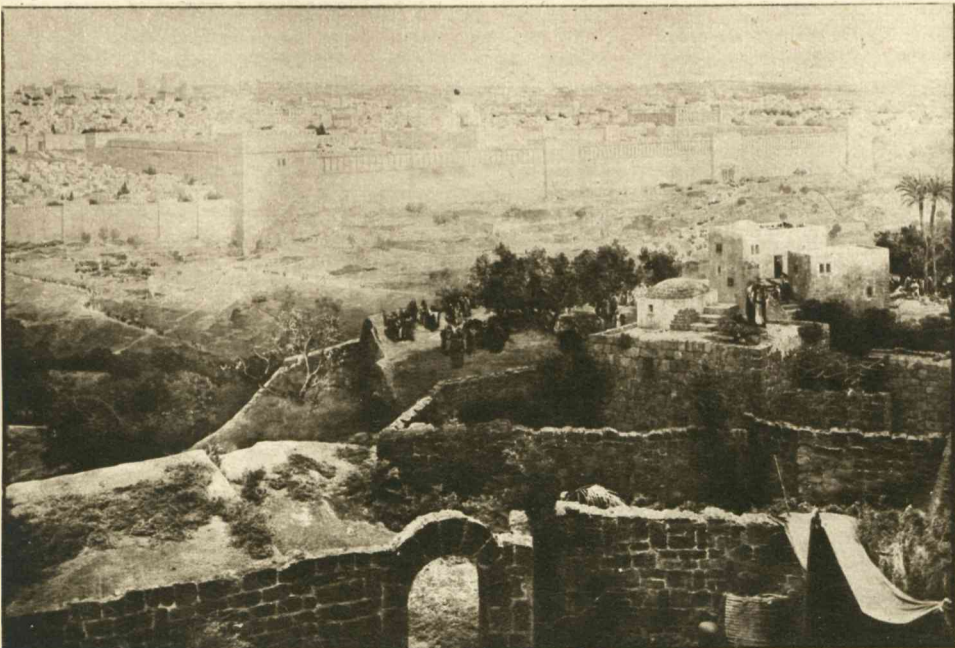
Gezicht op Jeruzalem. — De bovenstad met tempelplein.