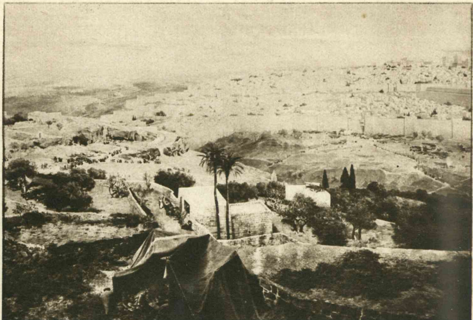
Jeruzalem. — De benedenstad en de bovenstad.