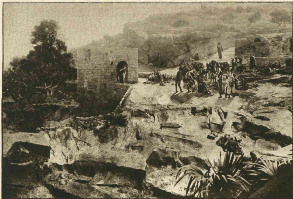
Karavaan van kooplieden bij de bron.