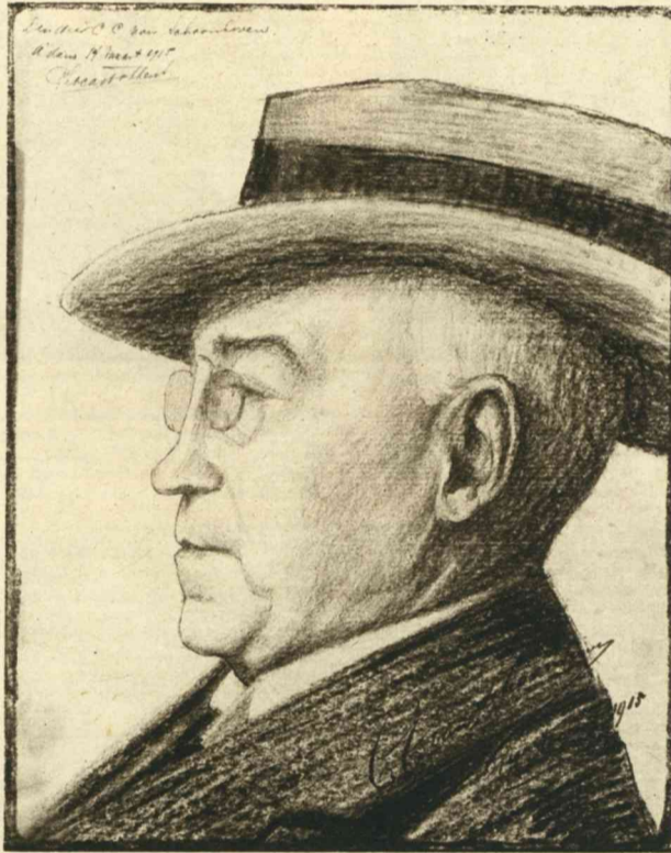
BIJ VAN SCHOONHOVEN.

„U zult in allen geval een zegen wezen — voor een gelukkigigen man,“ antwoordde ik stoutmoedig.