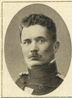
W. E. VAN KERVEL.

Door een hevige regenbui, die zich Woensdag 30 Juni boven Almelo ontlastte, kwamen verscheidene straten voor 'n groot gedeelte onder water te staan, waardoor het verkeer eenige stoornis ondervond. Onze foto doet op duidelijke wijze zien, welk een overstroming de wolkbreuk veroorzaakte.