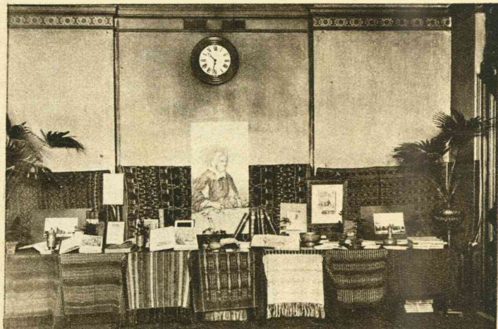
TENTOONSTELLING NATUURWETENSCHAPPELIJK PIONIERSWERK.