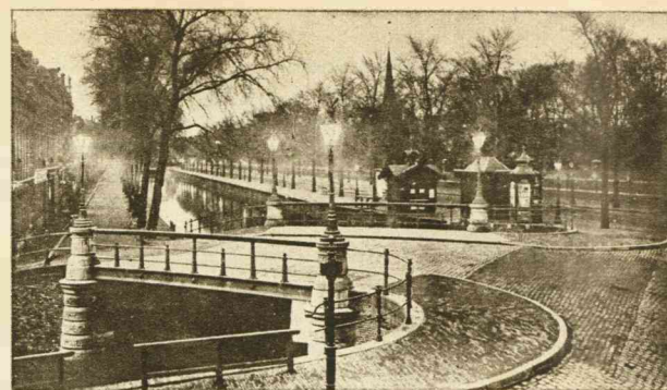
WINTERSTEMMING IN DE STAD.

Hoe, wist hij nu nog niet. 't Zou wel van 't kapitaal af