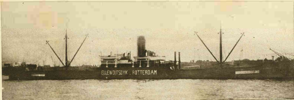
DE „ELLEWOUTSDIJK” GEZONKEN.

De „pleegvader”, tevens jager, van de beide jonge koningstijgers die met de zuigflesch worden grootgebracht.